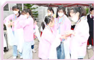
同學在粵劇展覽館體驗中國傳統粵劇藝術