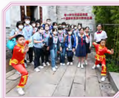
同學參觀永慶坊李小龙故居