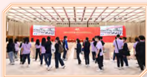
同學參觀前海國際會議中心

為讓學生實地了解國家的最新發展，培養他們的國民認同感，教育局邀請本校於2023年4月3日至4月4日(星期一及星期二)參加首個高中公民與社會發展科(公民科)學生內地考察團。由教育局局長蔡若蓮博士、副秘書長陳慕顏女士及首席助理秘書長葉秀媚女士帶領，本校由袁校長、羅副校長及13位老師陪同125位中五同學參加，與漢華中學師生，合計約250人，隨團者還有多位教育局工作人員。期間同學參訪廣州和深圳不同地點，包括陳家祠、永慶坊、粵劇藝術博物館、南沙經濟技術開發區(參觀科技創新企業小馬智行)，前海深港夢工場和前海國際會議中心。