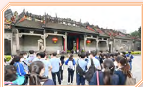
同學參觀陳家祠，認識中國雕刻和 建築藝術