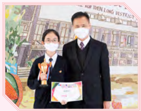
「一國兩制」與《基本法》