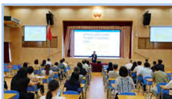
家長講座 家校合作——共同推動國家安全教育