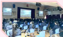
「悼念已故前國家主席江澤民」追悼活動

本校於全國追悼大會當天舉行「悼念已故前國家主席江澤民」追悼活動，於早上舉行升旗禮及下半旗致哀，並由同學分享江澤民先生的生平。於當天早上，全校師生觀看「全國追悼大會」直播，大會宣佈默哀時全校師生亦同步肅立默哀3分鐘。