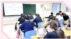
本校同學積極參與教育局舉辦的「2022「國家憲法日」網上問答比賽」。

本校於學校大堂設置壁報板板簡介《憲法》和《基本法》的歷史背景和重點內容，加深同學對國家機構的職權、公民的基本權利和義務的了解，以及《憲法》與香港特別行政區和《基本法》的憲制關係。