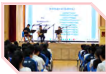
中國傳統音樂表演和講座