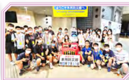
同學學習與防災相關的知識和技能