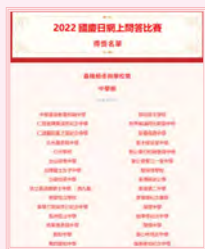
2022國慶日網上問答比賽 本校獲「中學組積極參與學校獎」