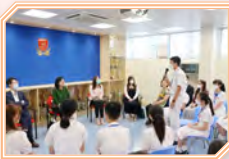
同學分享公民科內地考察團的得著