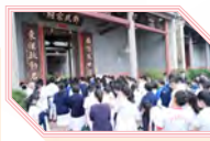
中一同學到屏山 文物徑考察，學習 中國傳統建築特色