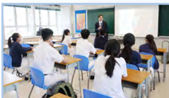
升學及就業輔導——職業博覽