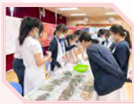
同學參觀醫藥展覽

為推廣中國文化，讓同學深入了解中國文化之精髓，提升同學的愛國情懷，本校舉辦中華文化周。文化周節目多元精彩，有工作坊、展覽、表演、講座、考察和升旗比賽。