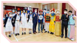
同學試穿中國戲曲服裝