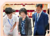
同學細心地向教育局局長蔡若蓮博士介紹內地考察團延伸學習的成果