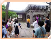
同學參觀著名藏書樓天一閣