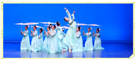
第59屆學校舞蹈節 最高級別獎項之優等獎 元朗區校際舞蹈比賽 金獎