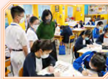
李秘書長及教育局人員蒞臨本校參觀

2023年5月10日（星期三），教育局常任秘書長李美嫦女士，JP、副秘書長杜永恒先生，JP、首席助理秘書長（學校行政）張巧儀女士、高級學校發展主任（元朗）劉可欣女士及學校發展主任（元朗）李焜玉女士蒞臨本校參觀，了解本校在國民教育方面的學與教情況，期間觀賞了中華文化周的各種表演和展覽，以及公民科內地考察的成果展示。完結時，秘書長鼓勵同學爭取機會親身體驗和了解祖國的歷史、文化與最新科技發展。