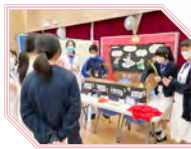
同學積極參與攤位遊戲