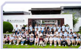
本校與姊妹學校師生大合照