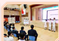
同學與嘉賓分享考察團的學習成果