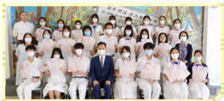
香港學校戲劇節2022/23 傑出導演獎、傑出劇本獎、傑出合作獎、傑出演員獎 第5屆聯校官中戲劇節2022/23 傑出合作獎、傑出舞台效果獎、傑出演員獎、 傑出整體演出獎