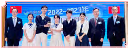
第18屆元朗區優秀學生選舉2023 最佳學校團體獎