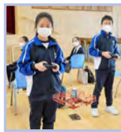
無人機編程訓練班