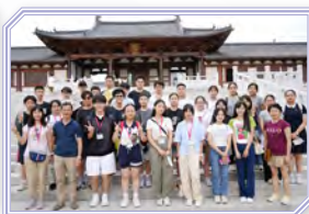
同學參觀南宋德壽宮遺址博物館