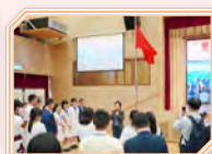
蔡局長表揚本校是次彙報及展覽，正是內地考察團延伸學習及體驗學習的最佳展示