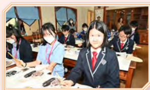
本校同學於廣州市執信中學參與美術 體驗課，認識當地的教育情況