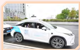
同學試乘自動駕駛車輛， 親身體驗國家科技之進步