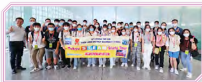
袁校長與杜副校長親自到機場送行，祝願同學享受豐富的學習歷程