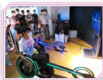
同學參觀千葉工業大學——東京晴空塔城校區