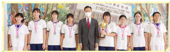
2023全港中小學學界（複球式）閃避球錦標賽 中學男子組優異（左）中學女子組亞軍（右）