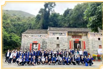
沙頭角歷史文化考察之旅

學校致力為學生提供有益身心的課外活動，於「其他學習經歷」課涵蓋價值觀教育、服務、與工作有關的經驗、藝術發展及體育發展五個範疇，拓寬學生視野，促進其全人發展。本校共設40多個學會，讓同學在服務、興趣、學術、藝術及體育等不同範疇發揮所長。