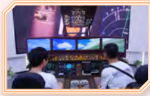
同學在華數傳媒總部參觀人工智能科技

本校中三至中五同學於2023年7月3日（星期一）至7月7日（星期五）前往寧波、杭州、上海，考察和學習中國的歷史、文化和經濟發展。同學又到訪姊妹學校—寧波市第二中學交流，認識內地的教育及文化。活動加深他們對國家歷史文化的認識，也提升他們的國民身份認同感。