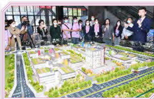
同學參觀前海深港夢工場