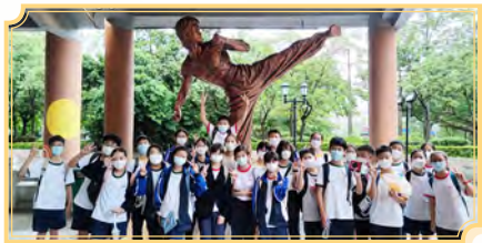
參觀香港文化博物館