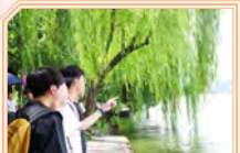
同學細味共賞西湖美景