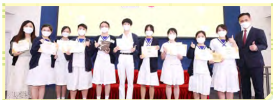
本校兩組隊伍參加由香港吸煙與健康委員會主辦、 教育局協辦的「無煙Teens 精英計劃2022-2023」， 第三團隊獲得「傑出無煙Teens 團隊亞軍」， 第四團隊則獲得「優異無煙Teens 團隊」。