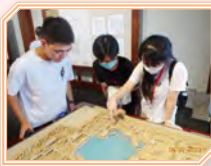
同學於德壽宮遺址博物館認真研習南宋歷史