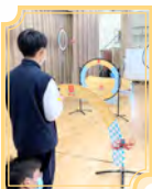
無人機避障暨 編程訓練班