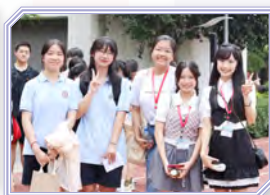
本校學生與姊妹學校同學互相交流學習