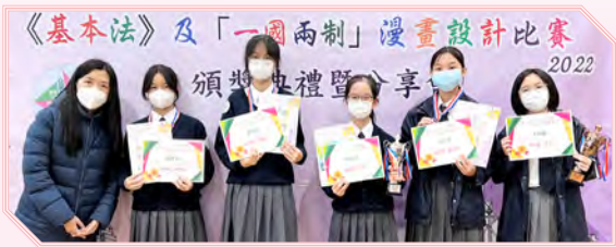
《基本法》及「一國兩制」漫畫設計比賽2022