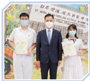
元朗區傑出義工選舉2022