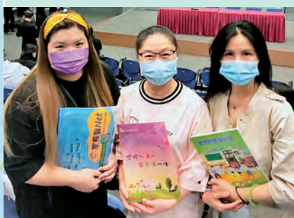
委員積極參與培訓課程