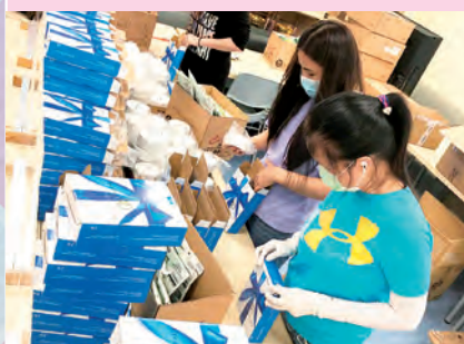
家長為畢業生準備禮物，送上祝福