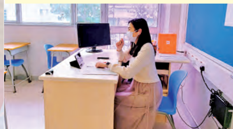
班主任以網上會議或電話形式與家長討論學生表現