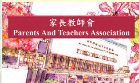
家長出席網上迎新家長日，了解鄉中的特色