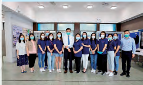
家長義工接待新同學及家長