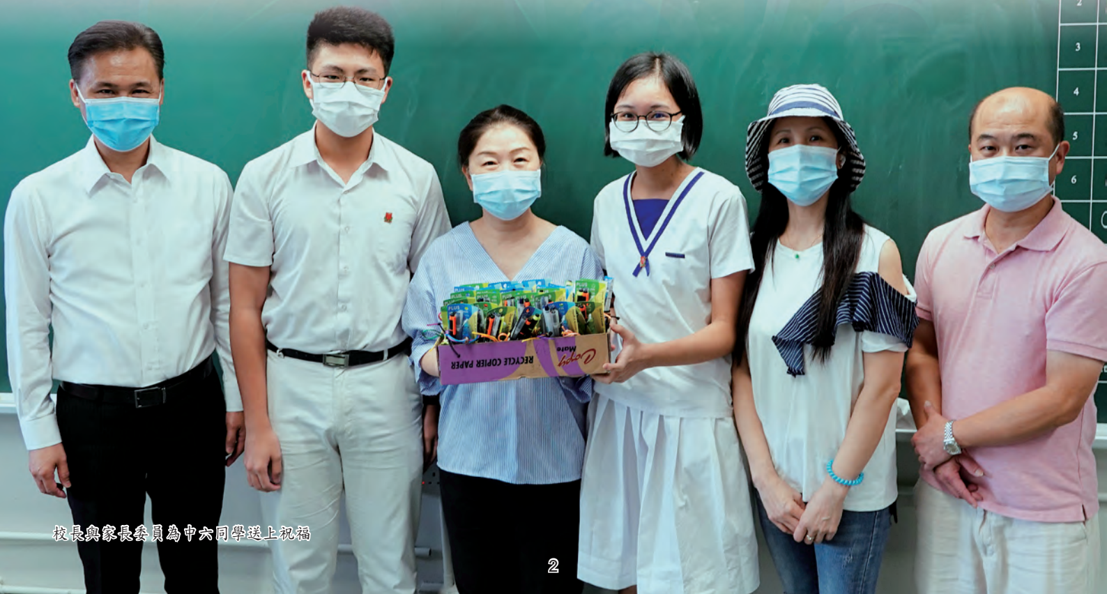
校長與家長委員為中六同學送上祝福