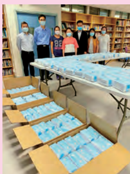
善心校友慷慨捐贈口罩，並由家長委員協助處理