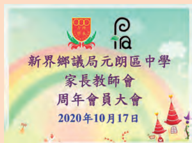
家長參與網上周年會員大會