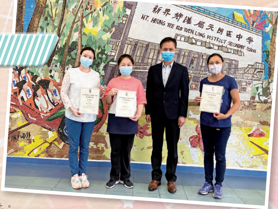
校長頒發感謝狀予上屆家長委員

縱然面對重重挑戰，各位「鄉中人」也不要過分憂慮，疫情總會過去，讓我們攜手合作，共同迎接更好的將來。