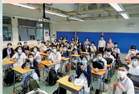
校長及家長委員在佳節贈送禮物，為中六同學打氣