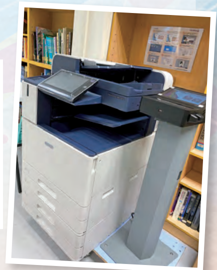
本會資助租用新影印機，方便同學影印學習材料