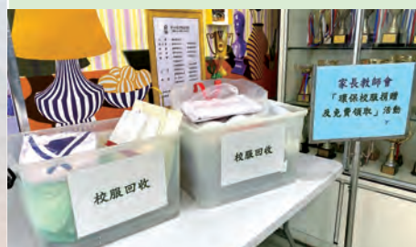
同學踴躍捐贈校服