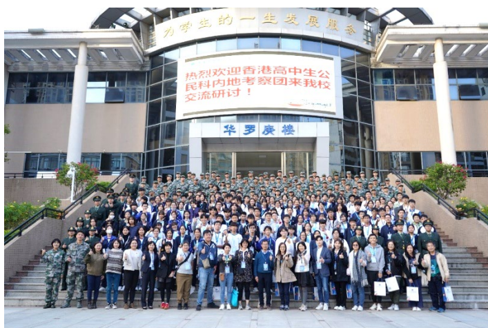
本校學生到訪惠州市華羅庚中學