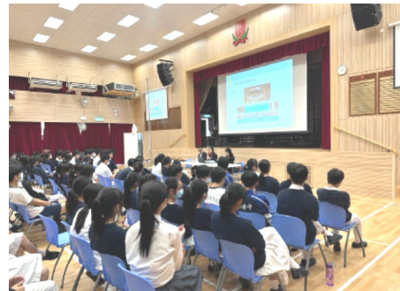
大灣區法律視角講座