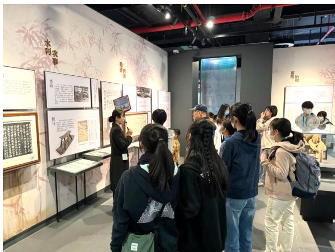
本校師生參觀東坡祠