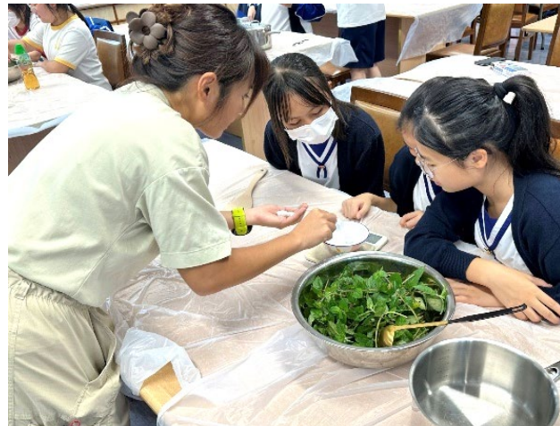
學生們認真聆聽導師的指導