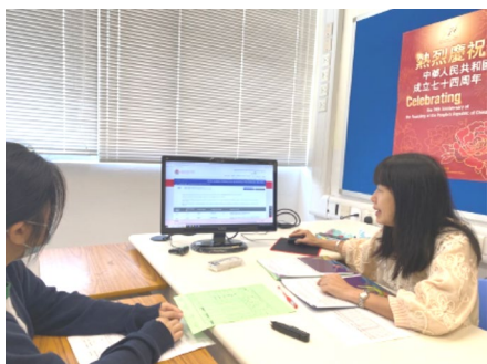
中六學生進行小組及個人面談

本組老師鼓勵學生參加各大院校的招生及推薦計劃，例如「大學聯合招生辦法」之校長推薦計劃、「學校推薦直接錄取計劃」、「內地部分高校免試招收香港學生計劃」之校長推薦計劃、「清華大學 2024 年香港推薦生計劃」、「2024 年暨南大學、華僑大學招收香港保送生計劃」、「香港演藝學院校長推薦計劃」、「北京大學博雅人才培養計劃」等，相關學生均獲校方推薦。