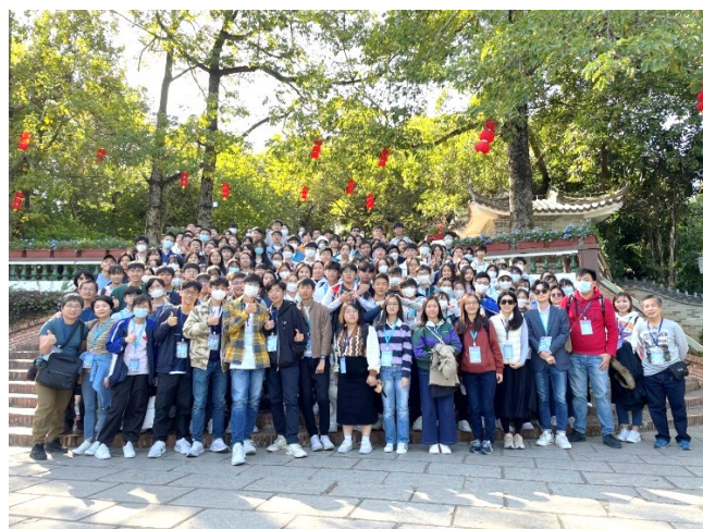
本校師生遊覽惠州西湖