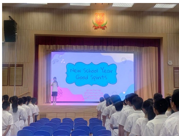
「新學年 好精神」早會短講