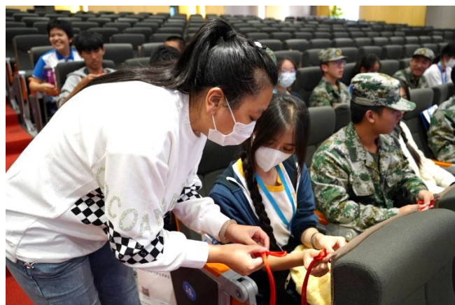
本校學生參與華羅庚中學的藝術課 學習中國結