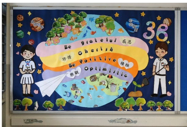
中三級冠軍 3B、「最佳創意獎」及「最佳色彩配搭獎」

本組於上學期舉辦了班際課室壁報設計比賽，各級冠軍如下：1C, 2A, 3B, 4B, 5A 及 6B。另 3B 獲「最佳創意獎」及「最佳色彩配搭獎」。