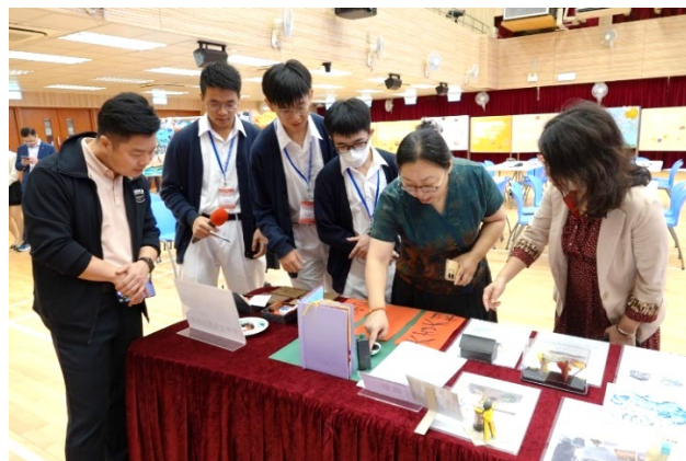
內地課程發展專家細看學生的專題研習報告