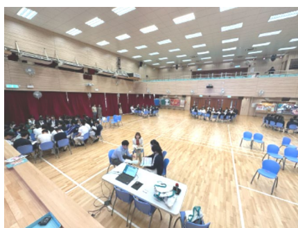
香港大學入學講座