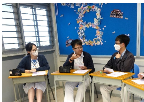
學生於「聯校英語說話訓練」中認真與友校學生交流。

本科於 2023 年 10 月 17 及 18 日舉辦「聯校英語說話訓練」，提供機會予學生於真實環境中運用英語，提升學生英語能力與溝通技巧，為公開試做好準備。