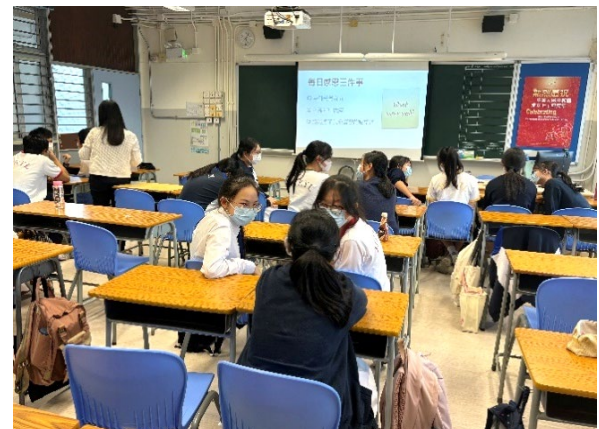
「守護大使」計劃啟動禮及培訓工作坊