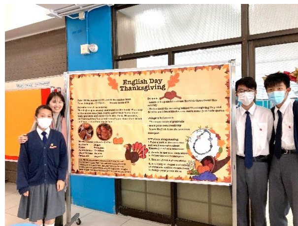
「午間點唱」，學生以英文表達對老師、家人、朋友的感謝

除了課堂學習外，英文學會亦於每個學期舉辦「英語日」，透過不同主題活動讓學生於輕鬆的環境學習及運用英語，並加強學生的學習動機及興趣。學生於感恩節及聖誕節期間製作展板，讓全校學生了解兩個節日的傳統、慶祝活動。活動當日亦有「午間點唱」，學生以英文寫上對老師、家人、朋友的祝福。英文學會亦會與其他學會合辦跨學科活動，如與歷史學會合辦電影欣賞，全面強化學生以英語學習不同科目。