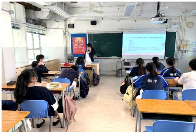
海馬同學會成員在班主任節向其他同學分享保護瀕危動物的重要性

30 位中一至中五級學生參加由海洋公園保育聯盟成立「海馬同學會」。參加者通過海洋公園提供的資源及活動，學習不同的保育知識。之後他們利用這些知識，領導全校學生參與海洋公園保育聯盟的三大旗艦活動，在校內宣揚保育訊息。其中在 11 月，參與學生在班主任節向其他同學分享保護瀕危動物的重要性。在 12 月亦舉辦了校園回收活動，將垃圾送到「綠在區區」回收。透過活動，學生能親身實踐學到的環保知識，並養成環保的習慣。