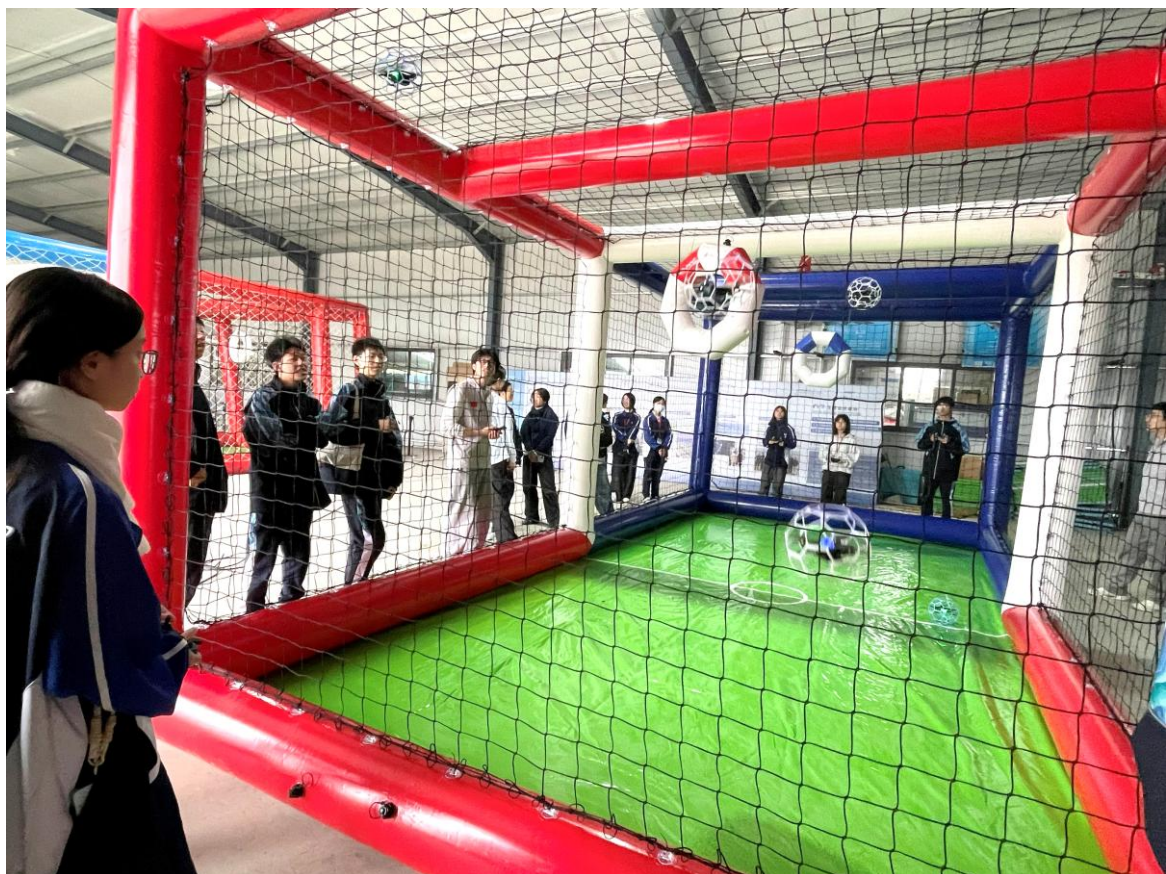
同學進行無人機足球比賽