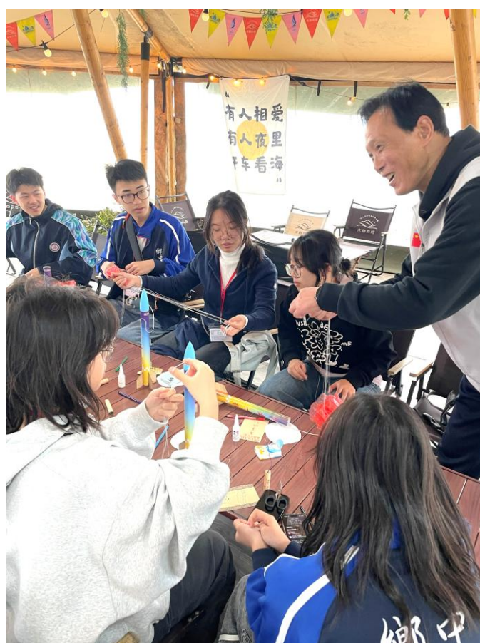
航空飛行營地導師細心教導本校同學製作火箭