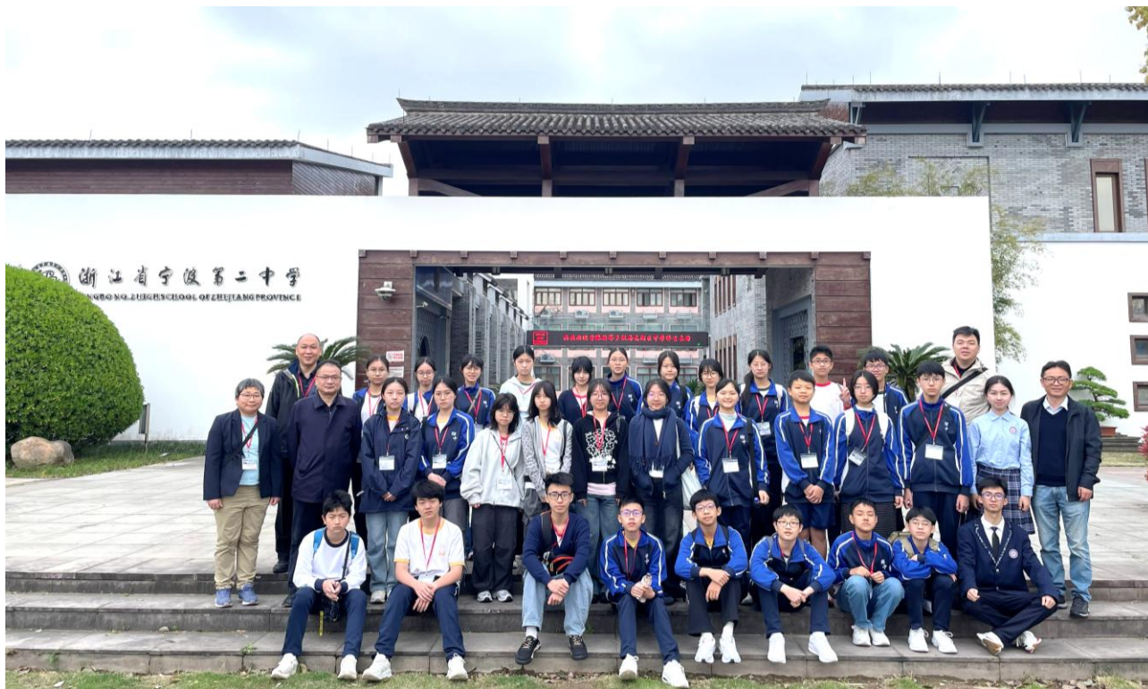
寧波市第二中學領導與本校師生於校園內合影