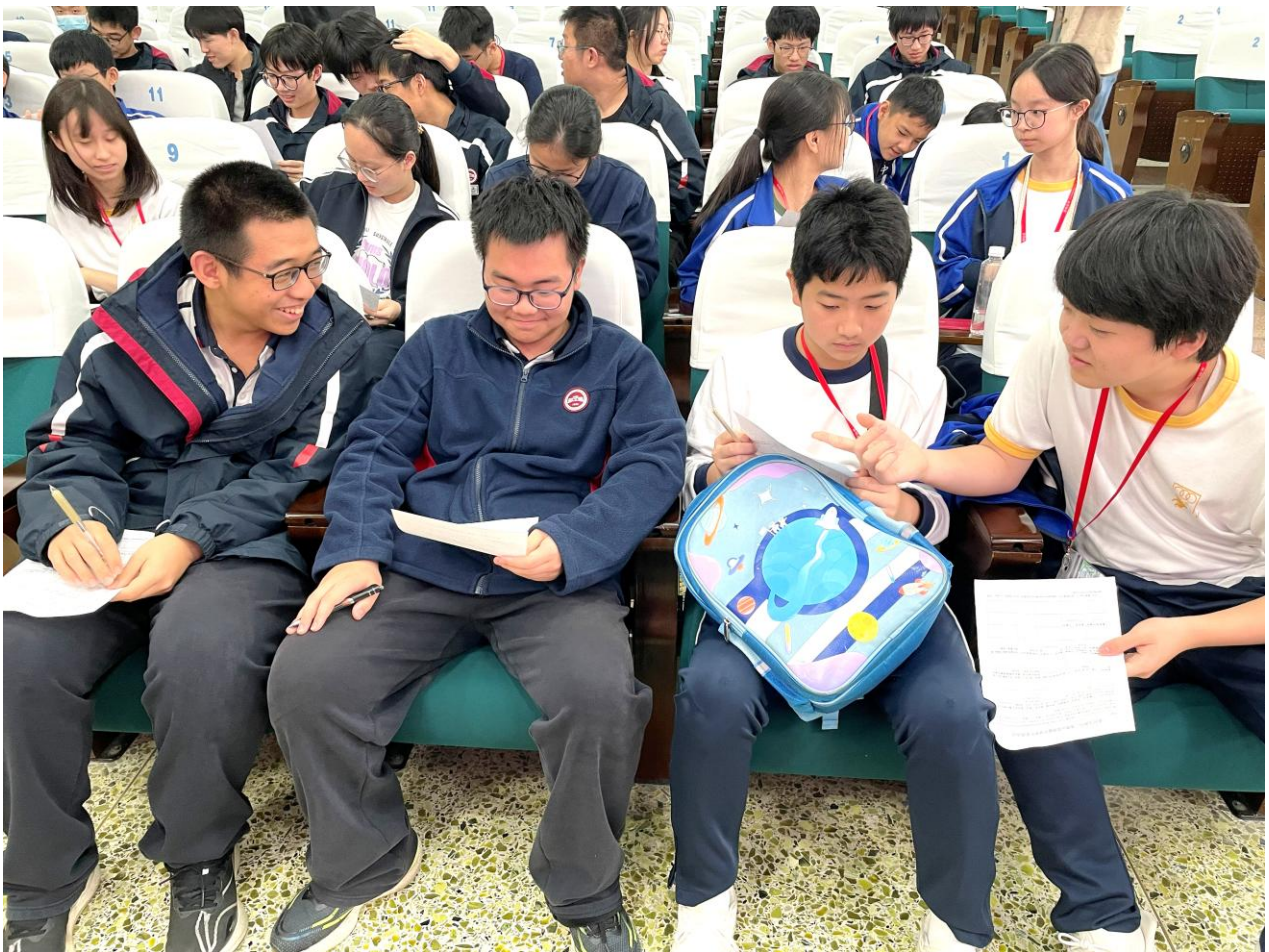
兩校同學互相交流