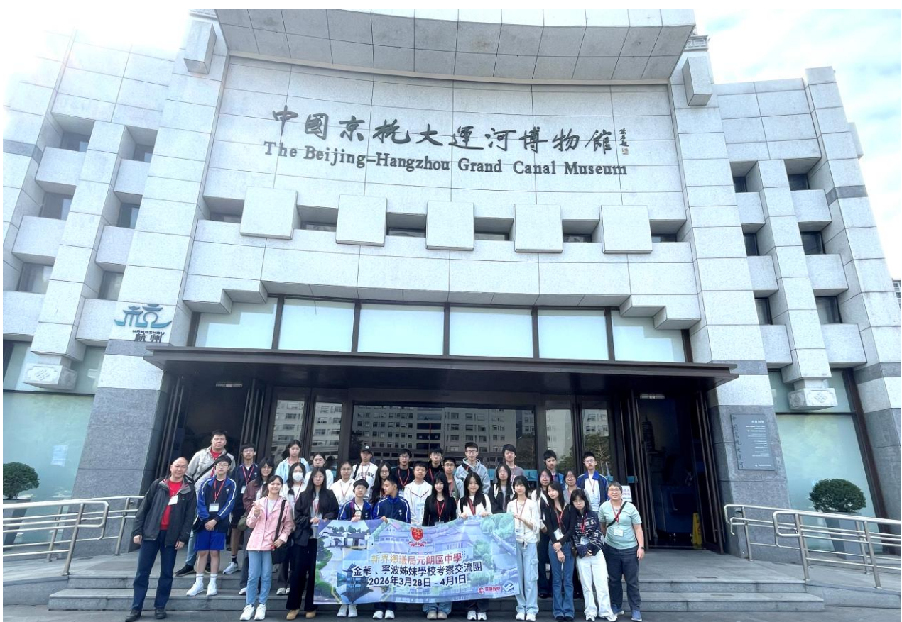
本校師生參觀中國京杭大運河博物館，了解運河歷史