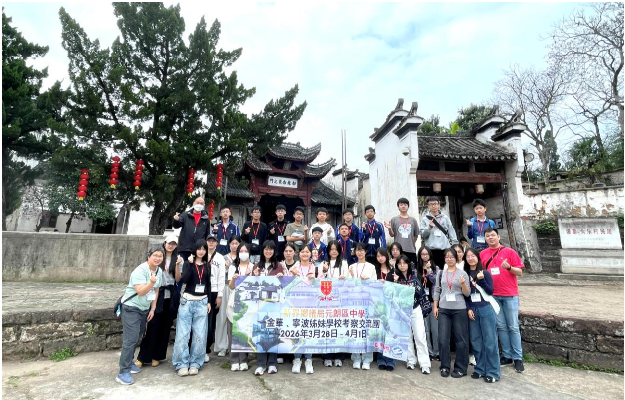
本校師生在諸葛八卦村內合照