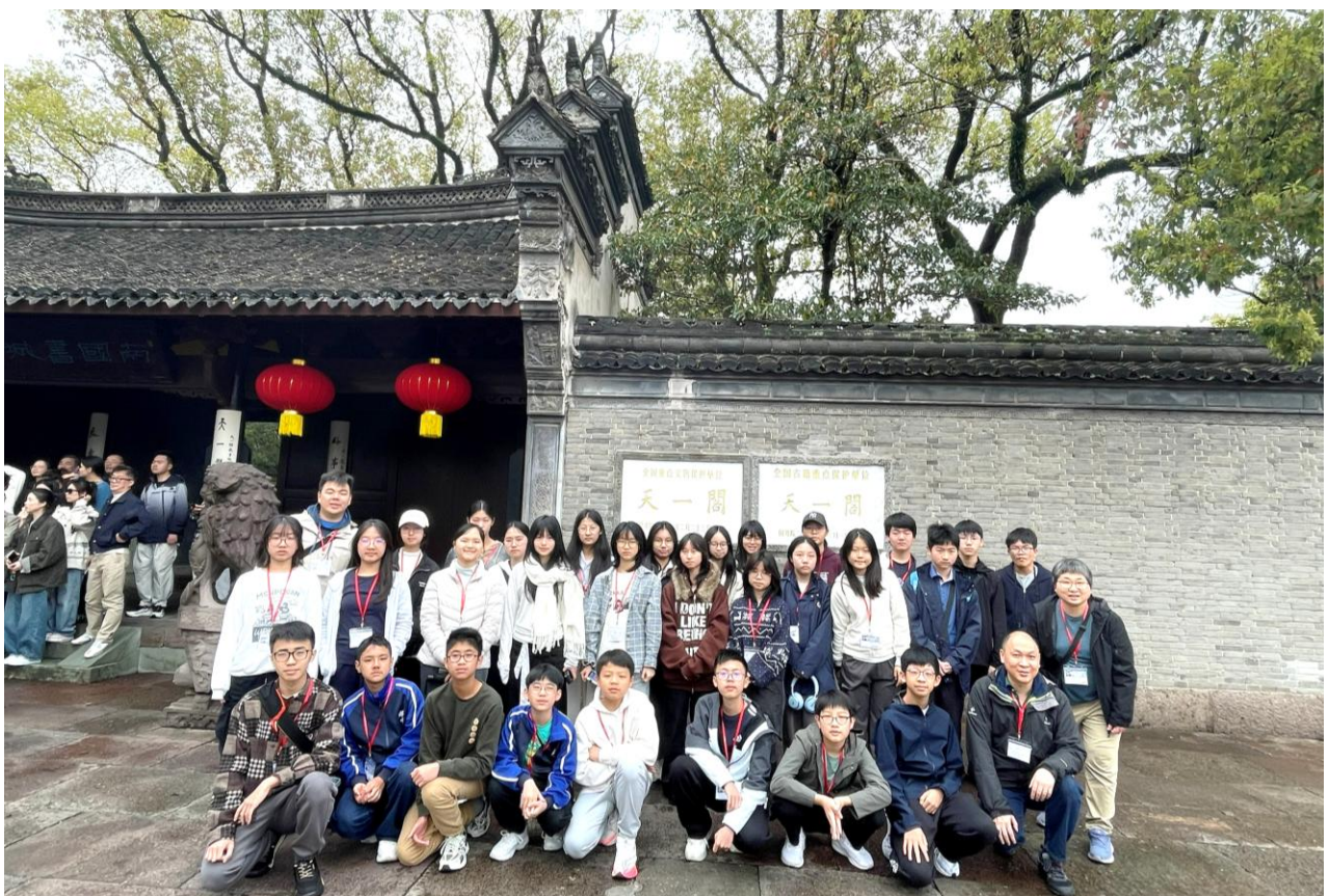
本校師生參觀天一閣，了解中國古代藏書樓歷史