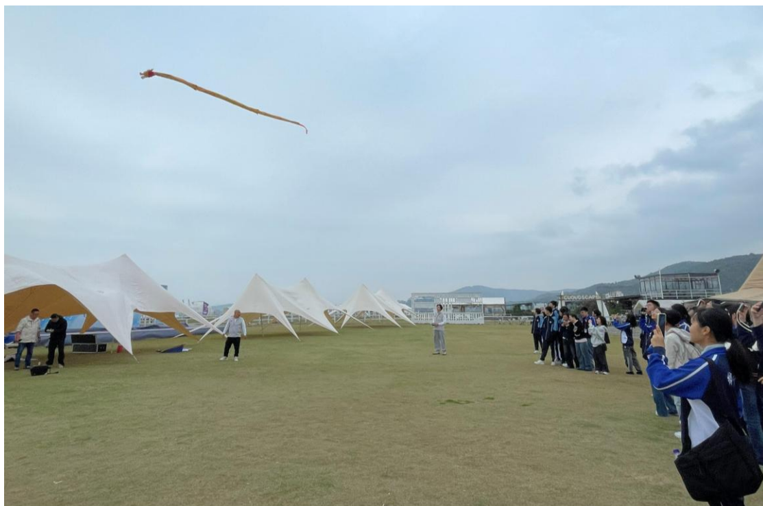
龍鳳呈祥無人機示範