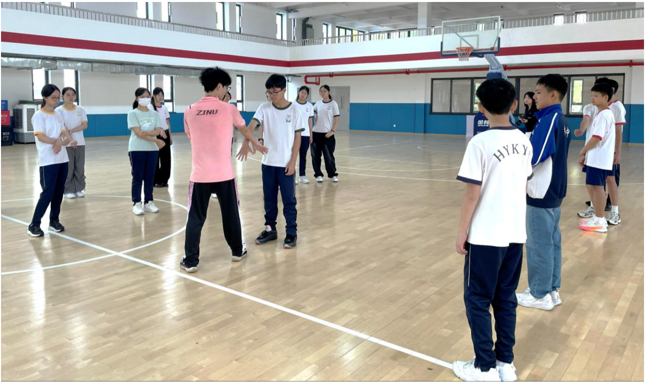
浙江師範大學附屬中學體育科老師教導傳統中國武術，激發學生對中華文化的興趣