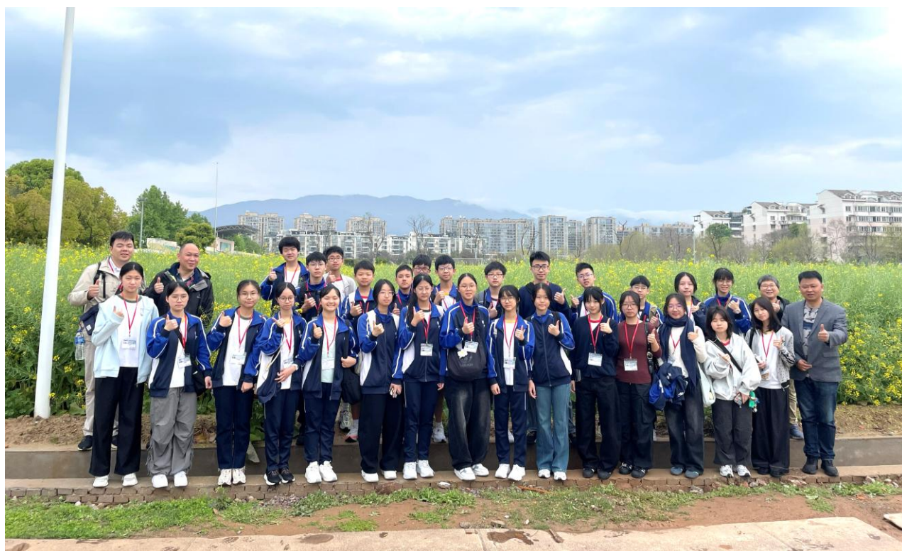
本校師生參觀校園，在油菜花前合影