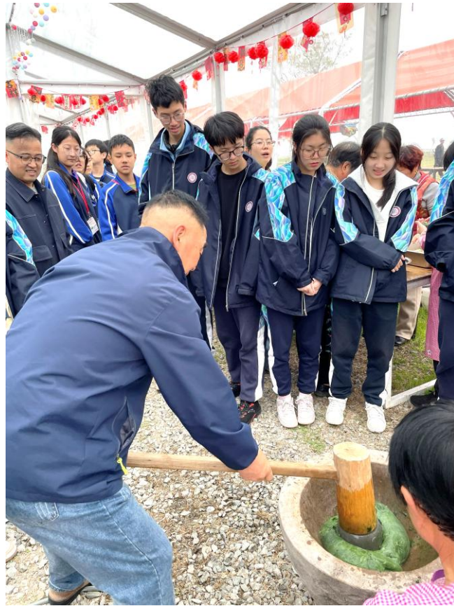
兩校學生一起參與清明食品青糰的製作