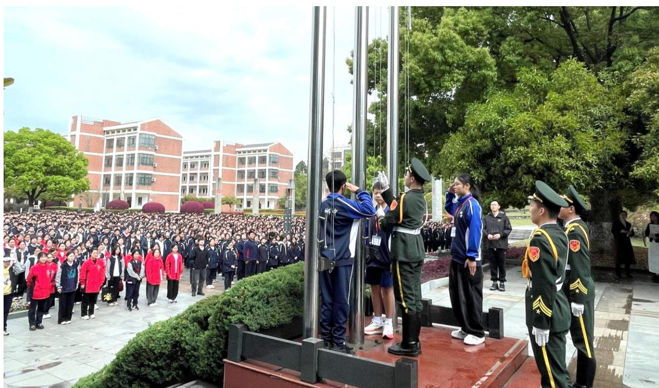
本校升旗隊代表英姿颯爽