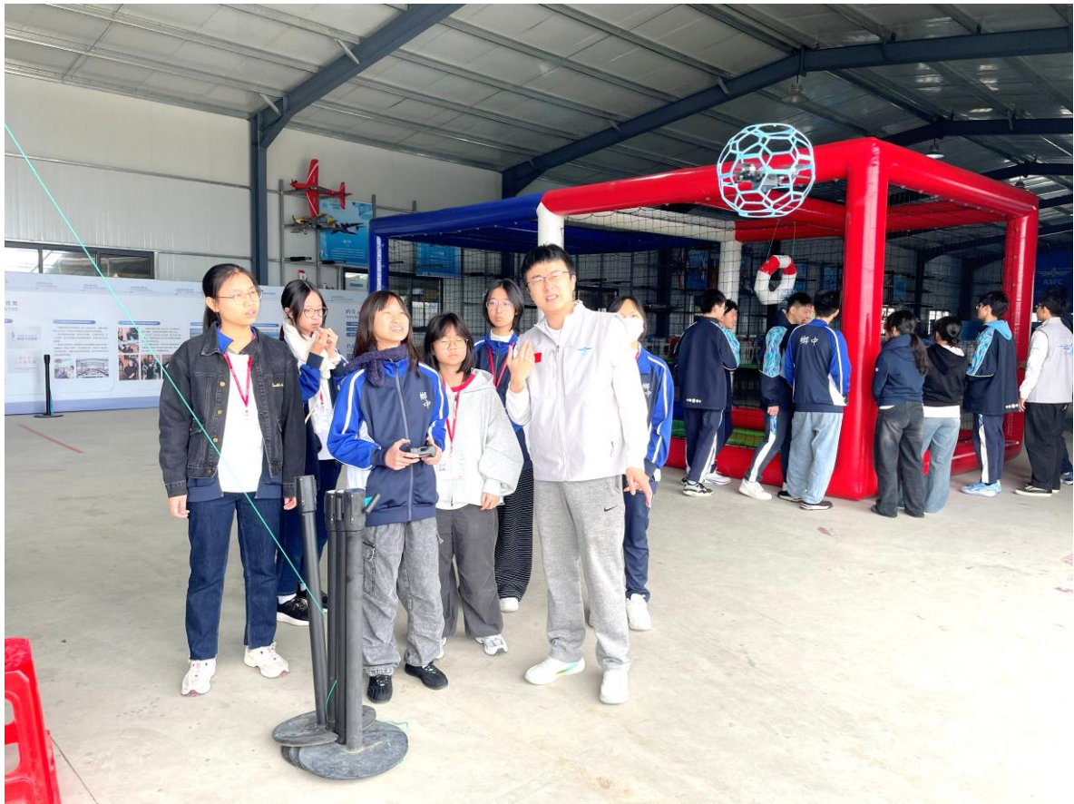
本校同學到寧波市第二中學咸祥航空飛行營地體驗無人機足球