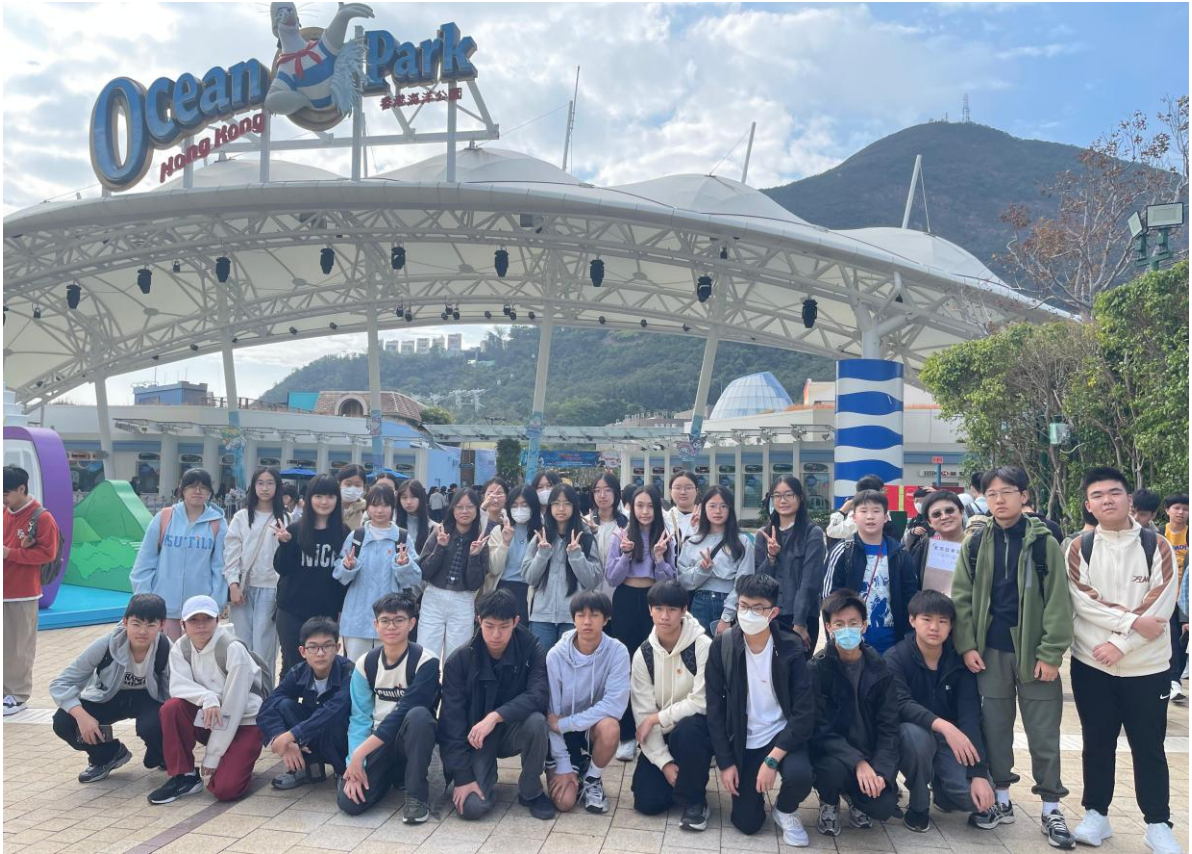
3A 班同學在海洋公園留影