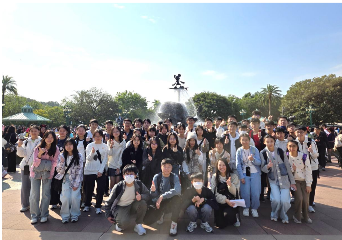
4D 班、4E 班同學在迪士尼主題樂園拍攝大合照