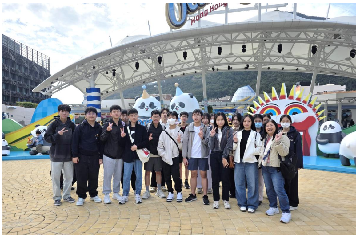
5C 班同學在海洋公園留影