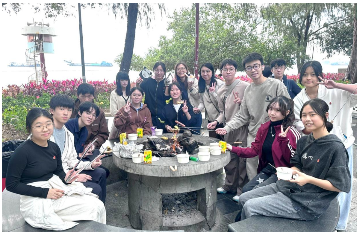
5B 班同學參加蝴蝶灣公園燒烤及戶外探索活動