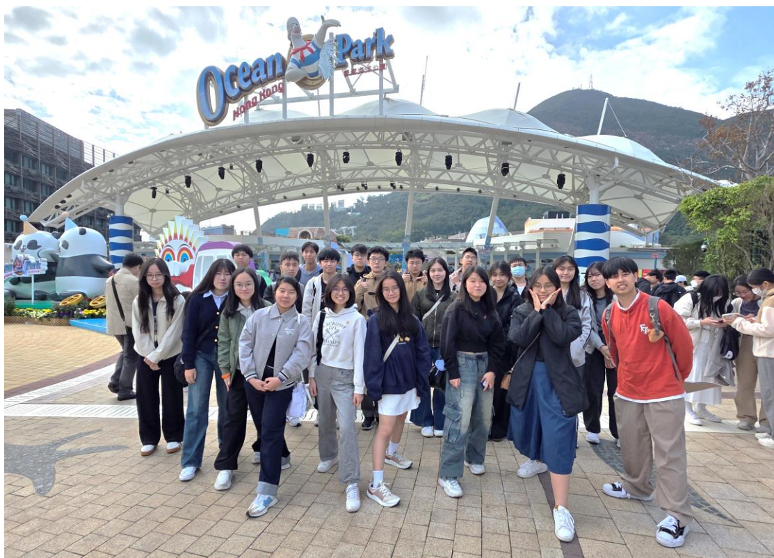
5D 班同學在海洋公園留影