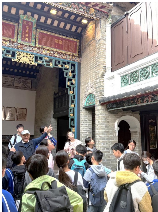
同學認真學習大夫弟的建築風格和歷史