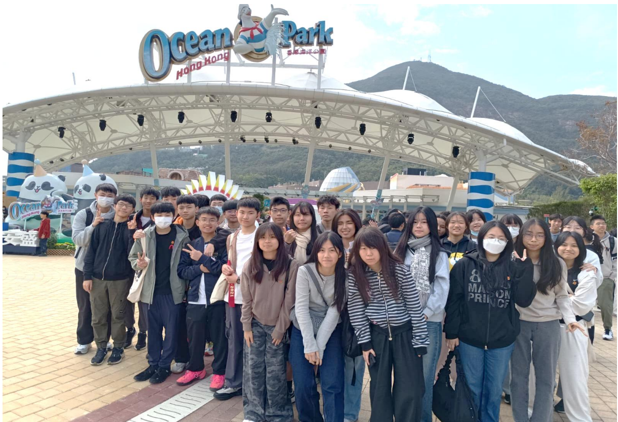
3B 班同學在海洋公園留影