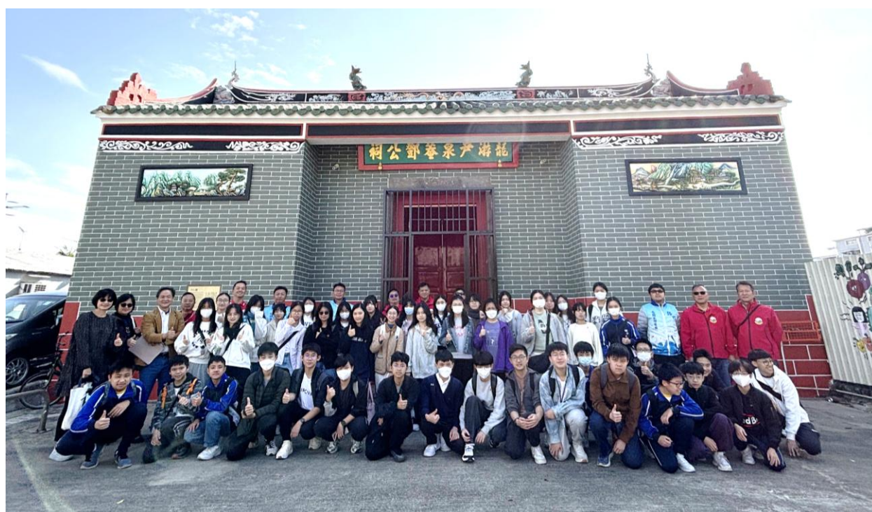
本校同學到錦田鄉參觀龍游尹泉菴鄧公祠