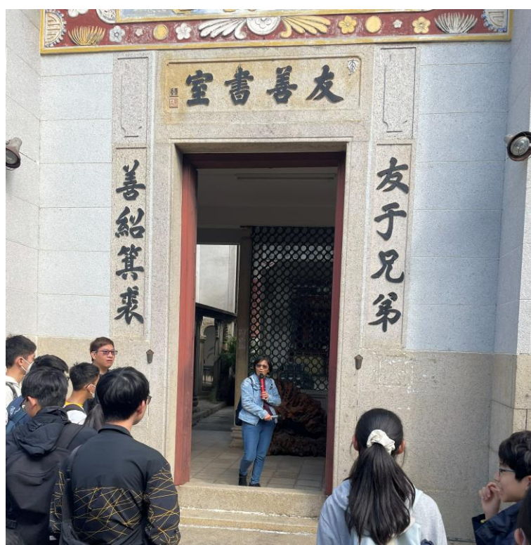
同學在厦村鄉友善書室認真聆聽講解員分享