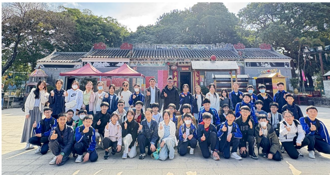
八鄉鄉事委員會代表與 1C 班、1D 班師生在八鄉古廟前合照。