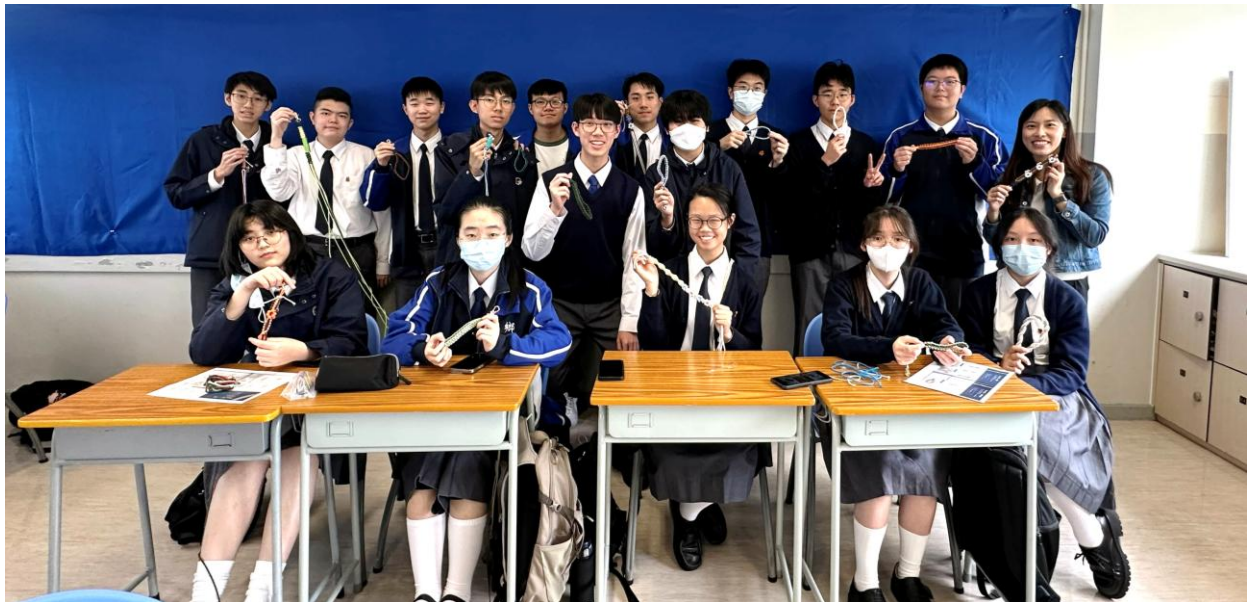
同學參加編織電話繩工作坊