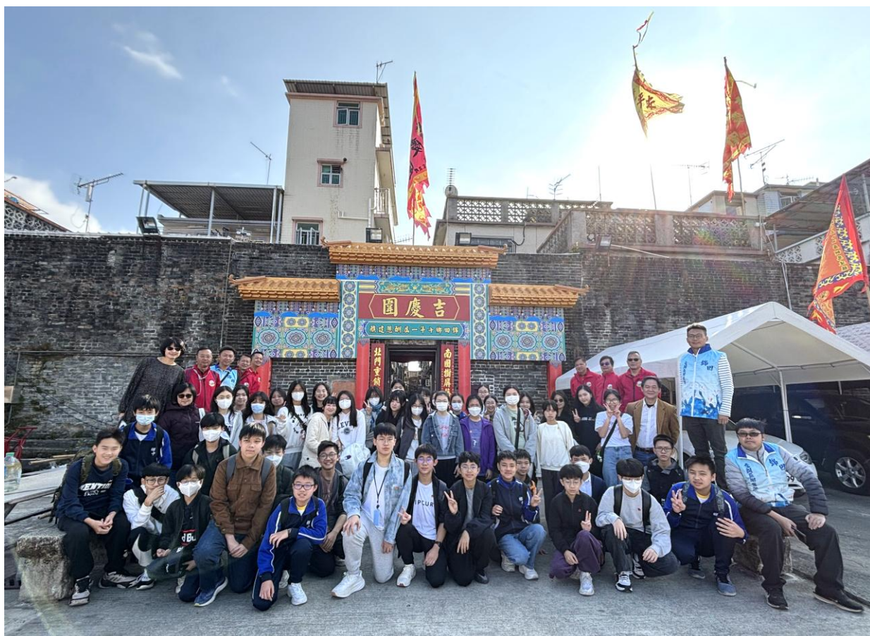
錦田鄉鄉事委員會代表與 2B 班、2D 班同學於吉慶園前合照