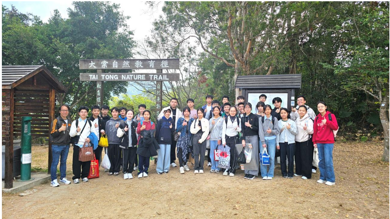
5F 同學參加大欖郊野公園燒烤與戶外探索活動