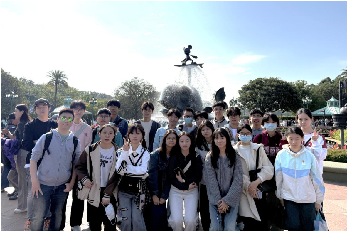
4C 班同學在迪士尼主題樂園留影