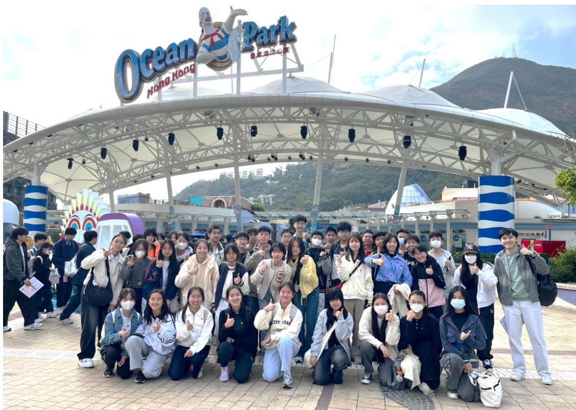
3C 班同學在海洋公園留影