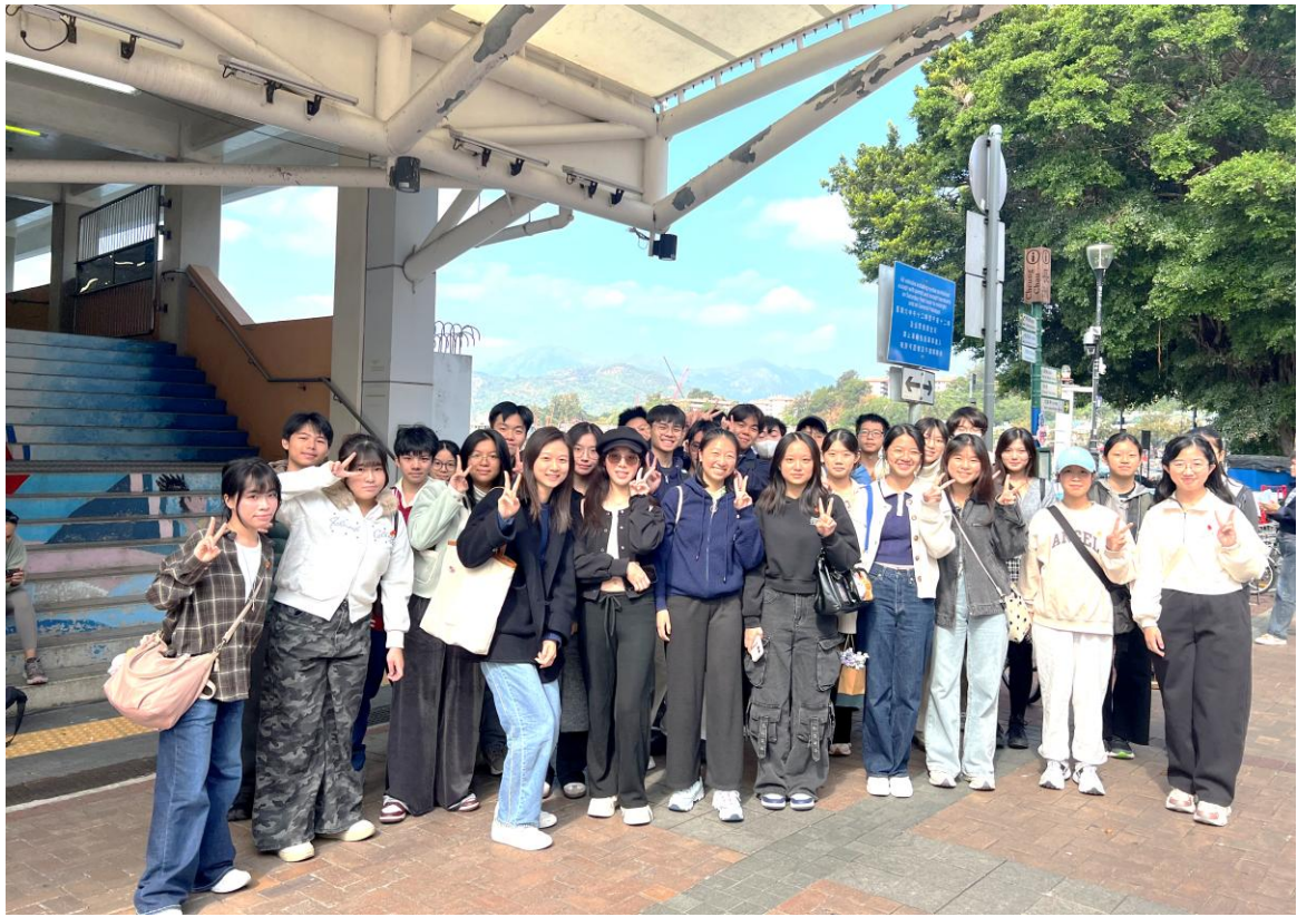
5E 班同學在長洲拍照留念