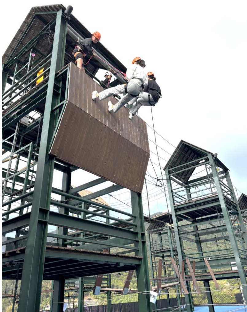
本校同學參與在「健康校園大使日營」內舉行之歷奇活動。