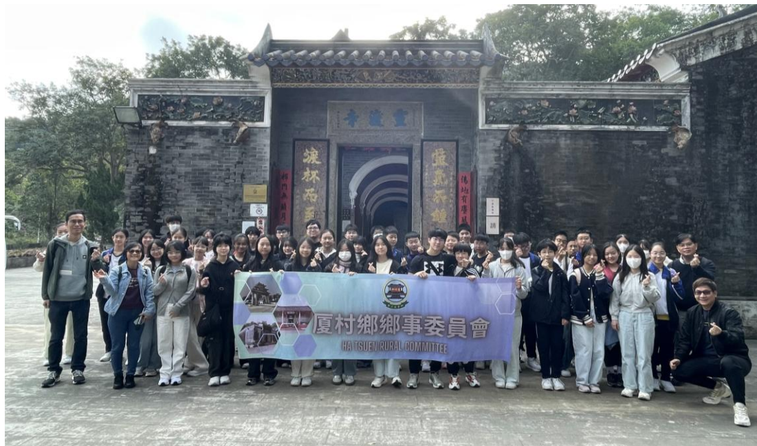
厦村鄉鄉事委員會代表與 2A 班、2D 班師生在靈渡寺前合照。