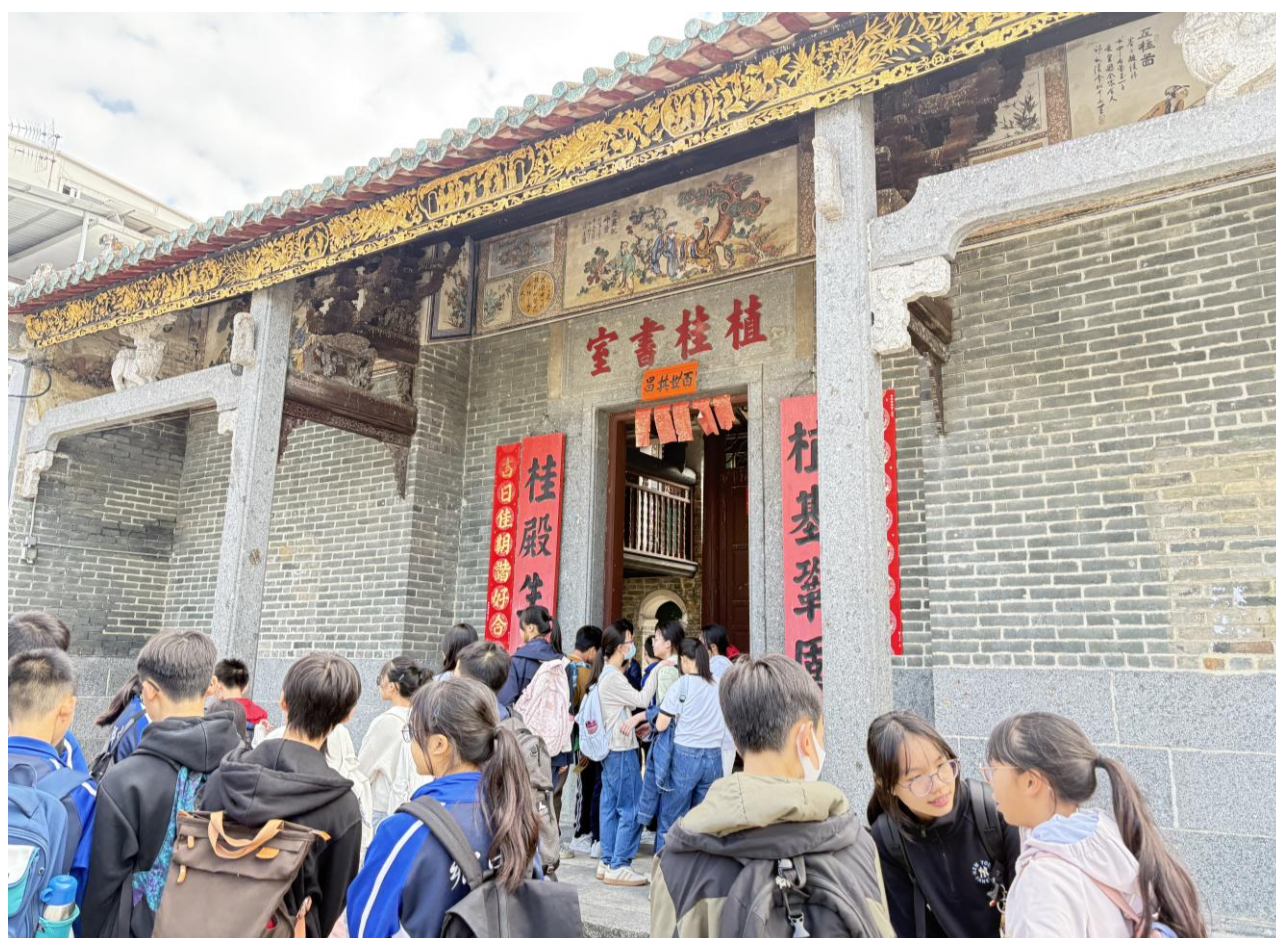
本校同學對植桂書室深感興趣