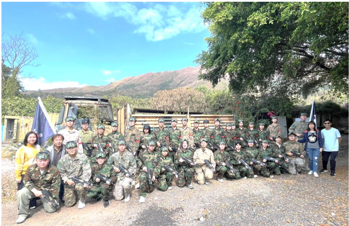
4A 班、5A 班同學參加元朗逢吉新村野戰團體體驗活動