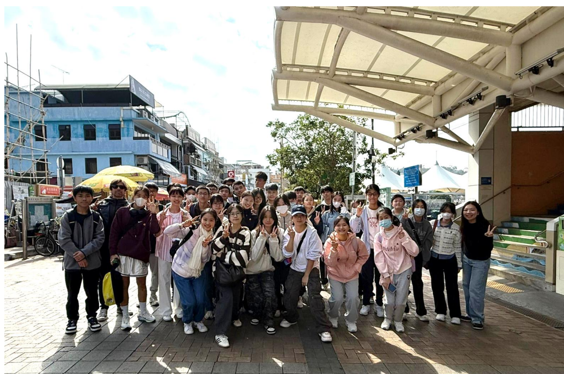
3D 班同學在長洲拍照留念