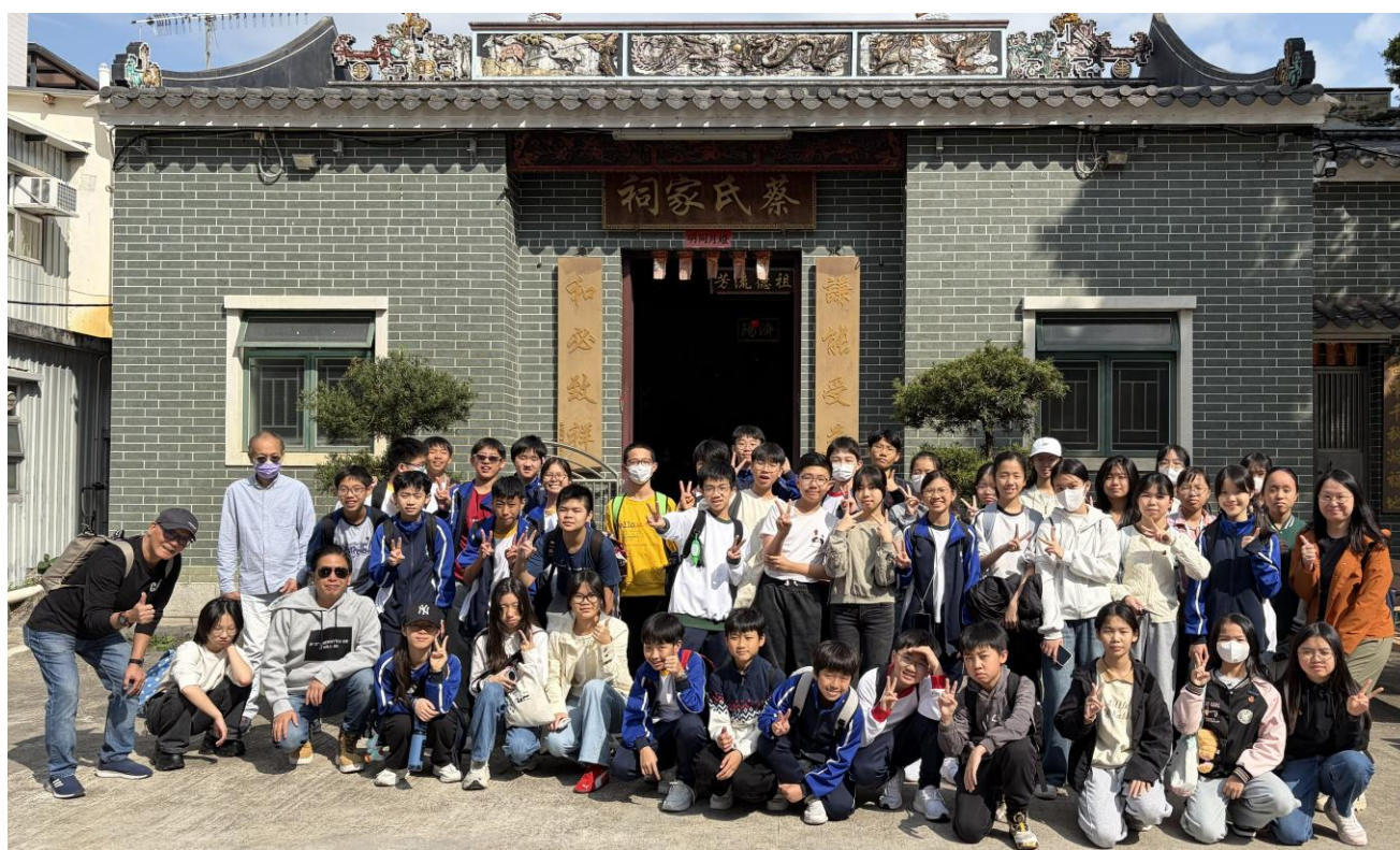
同學參觀十八鄉蔡氏家祠