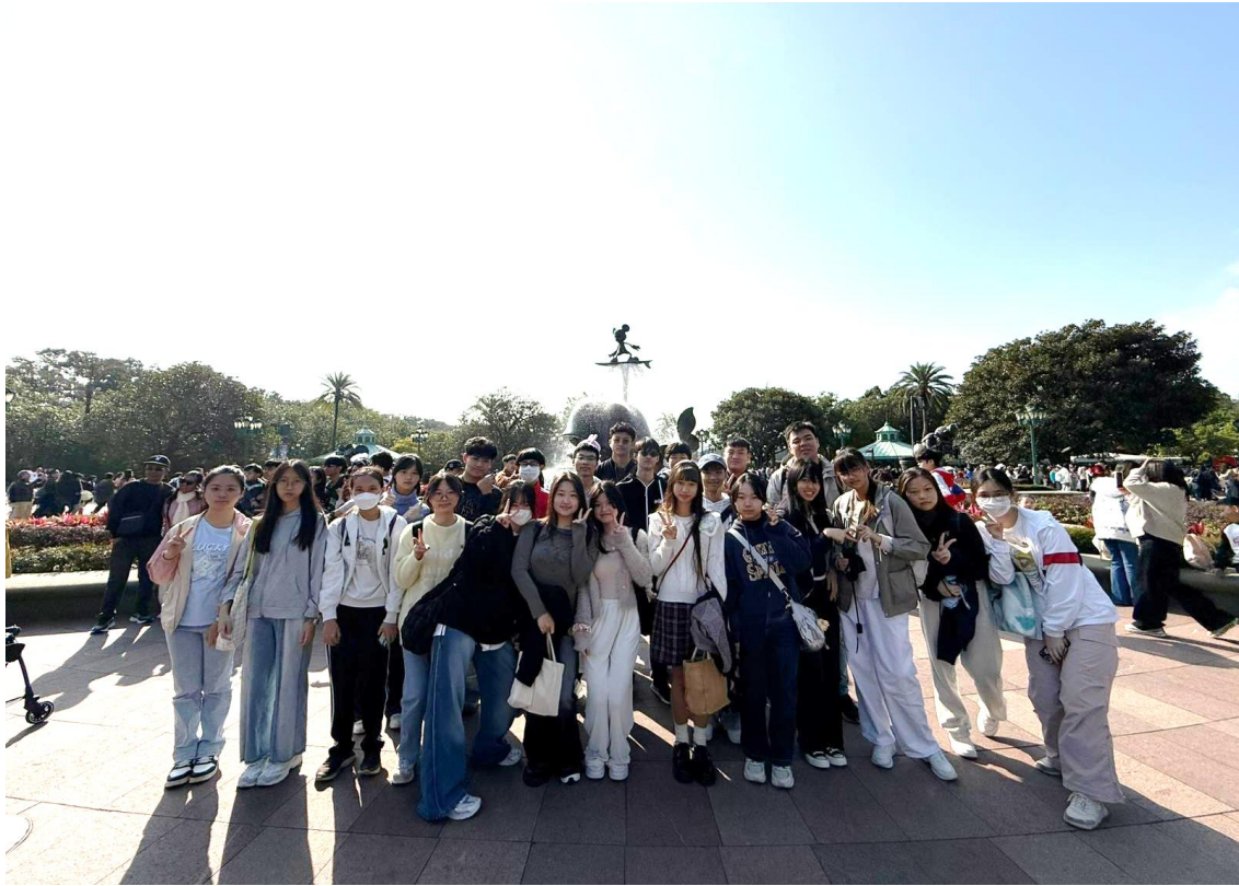
4B 班同學到迪士尼主題樂園遊覽