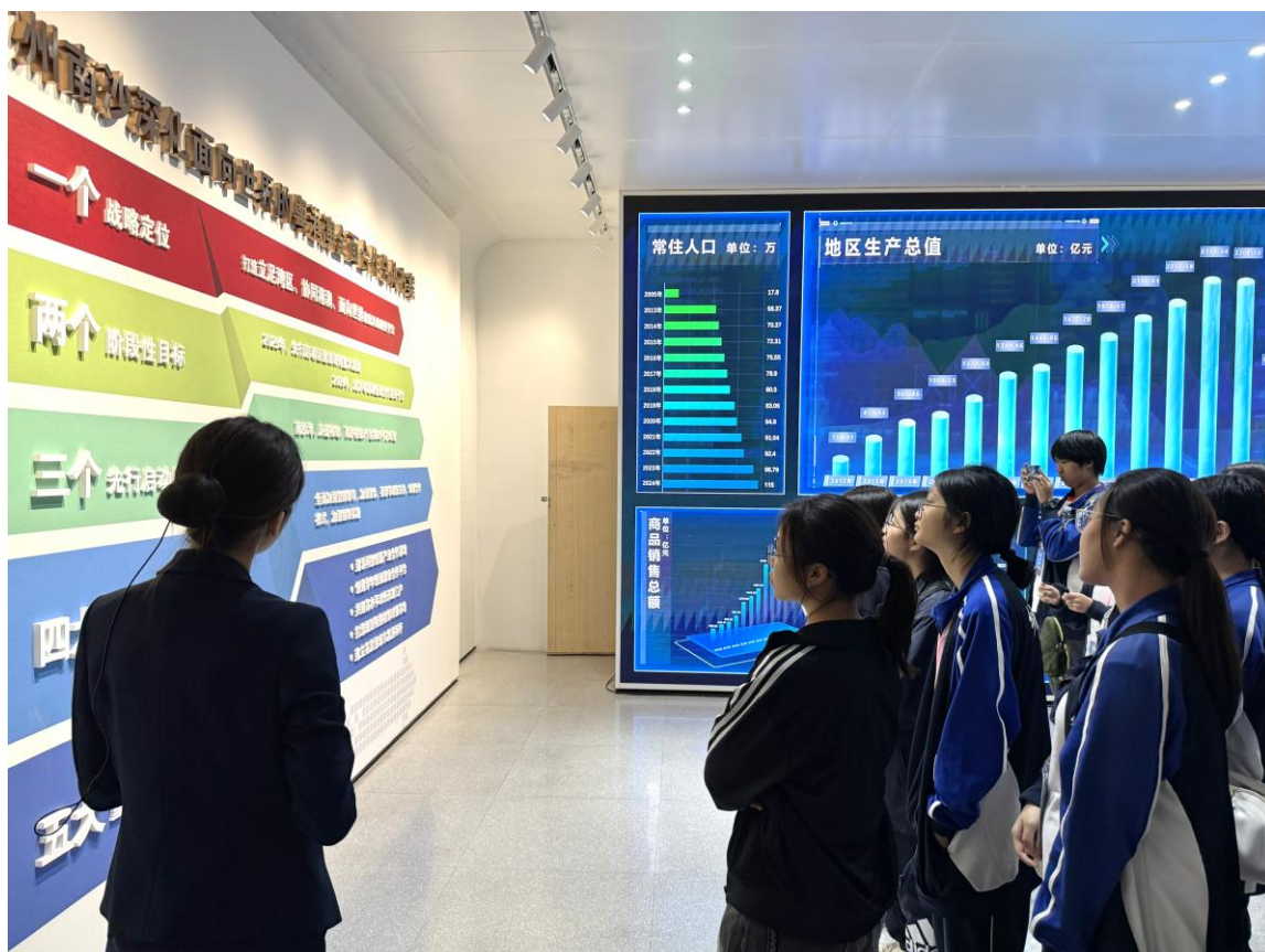
同學閱讀展板內容，深入了解南沙新區的發展規劃