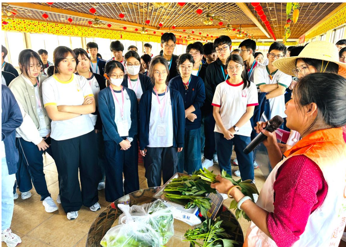
同學在農業園內聆聽工作人員講解整體運作