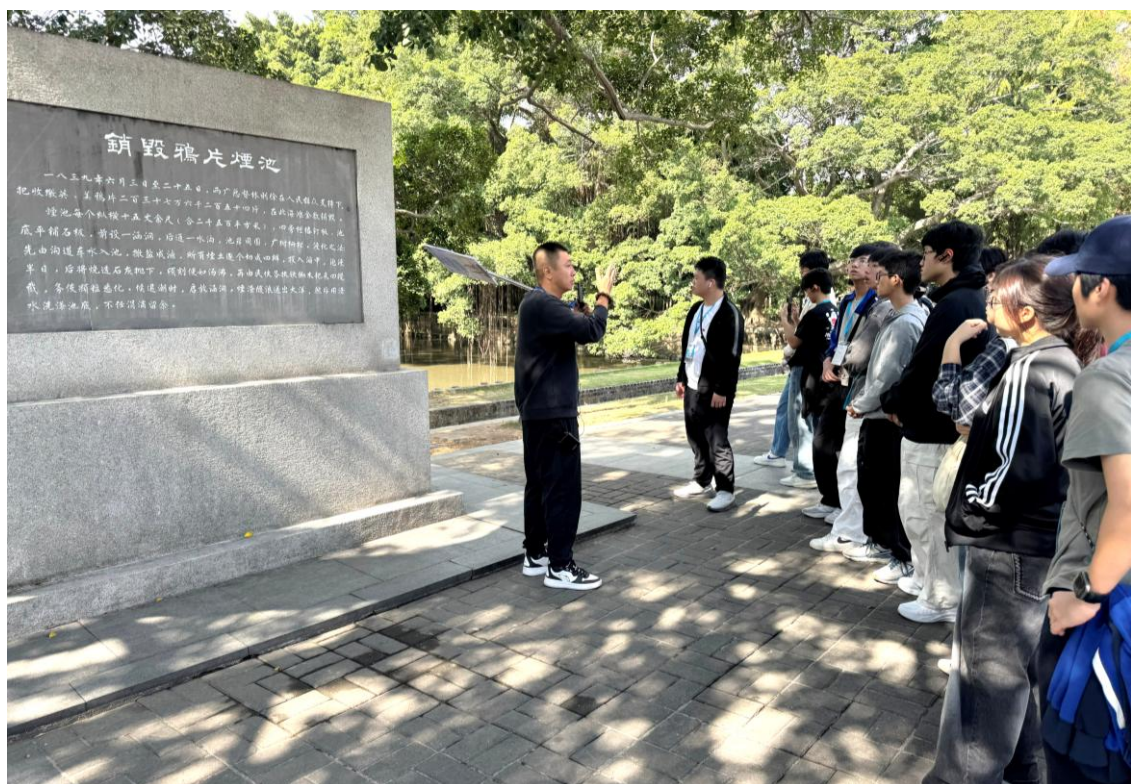
同學參觀虎門鴉片戰爭博物館