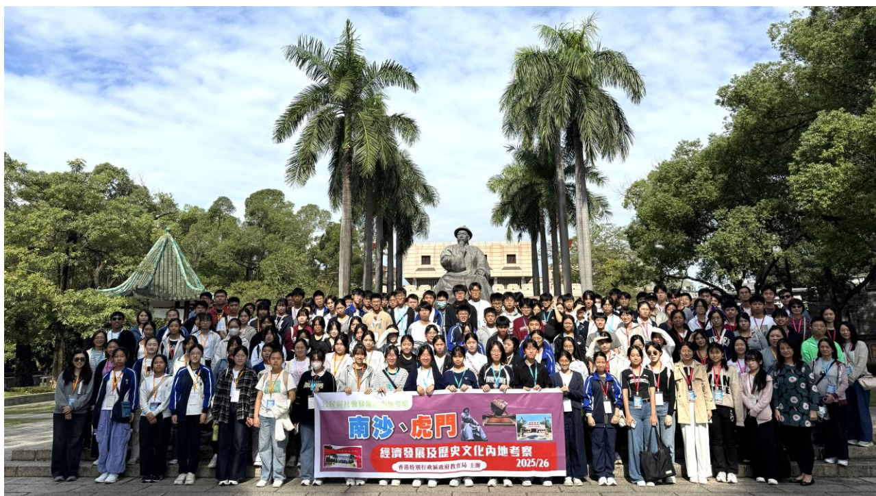
本校師生於鴉片戰爭博物館前拍照

第二天，本校同學參觀鴉片戰爭博物館，了解中國鴉片戰爭的背景，認識國家在歷史中所經歷的屈辱與抗爭，並從中培養國家認同感與愛國情懷。下午時分，同學到訪東江縱隊紀念館，了解抗戰歷史及東江縱隊在保衛國家中的重要角色，並從中體會革命精神與愛國情懷。透過兩天的行程，學生不僅加深對大灣區經濟發展的認識，亦從歷史文化中體會國家奮鬥歷程，進一步培養國家認同感及社會責任感。是次活動安排周全，學生獲得寶貴的學習經驗，為日後升學及事業發展奠定良好基礎。