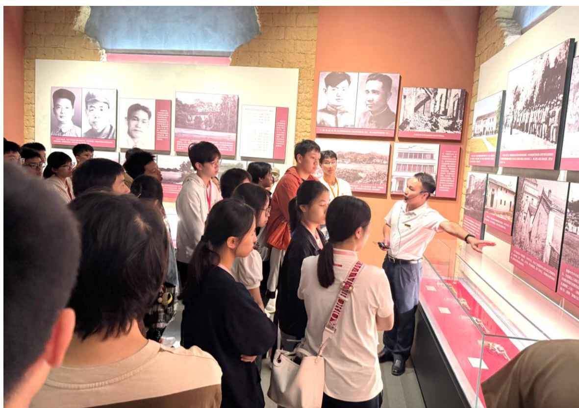
同學閱覽館內陳列的歷史文物與文獻資料