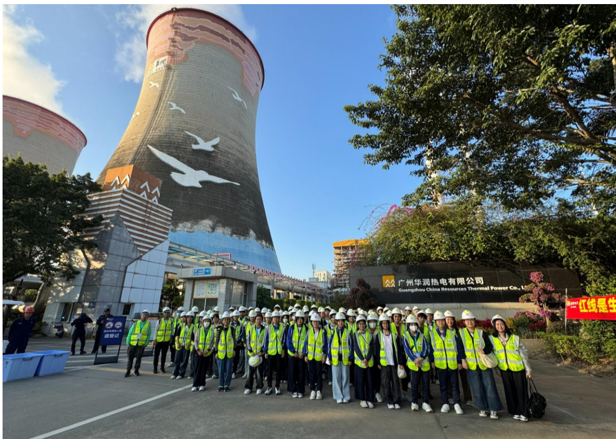
同學於華潤熱電拍攝大合照