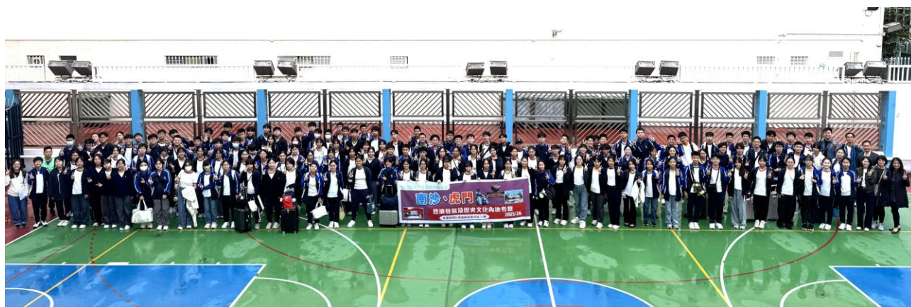
出發前，袁校長與中五同學於學校拍攝大合照