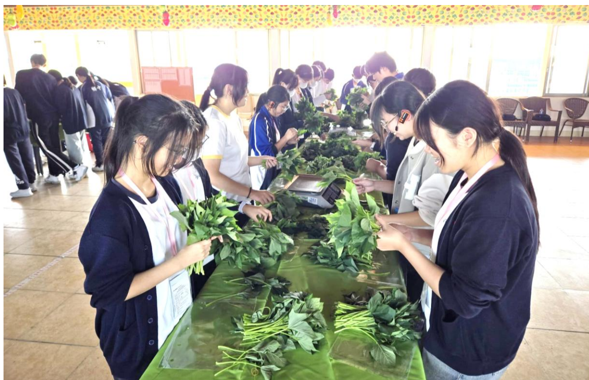
同學認真學習有機蔬菜包裝技巧