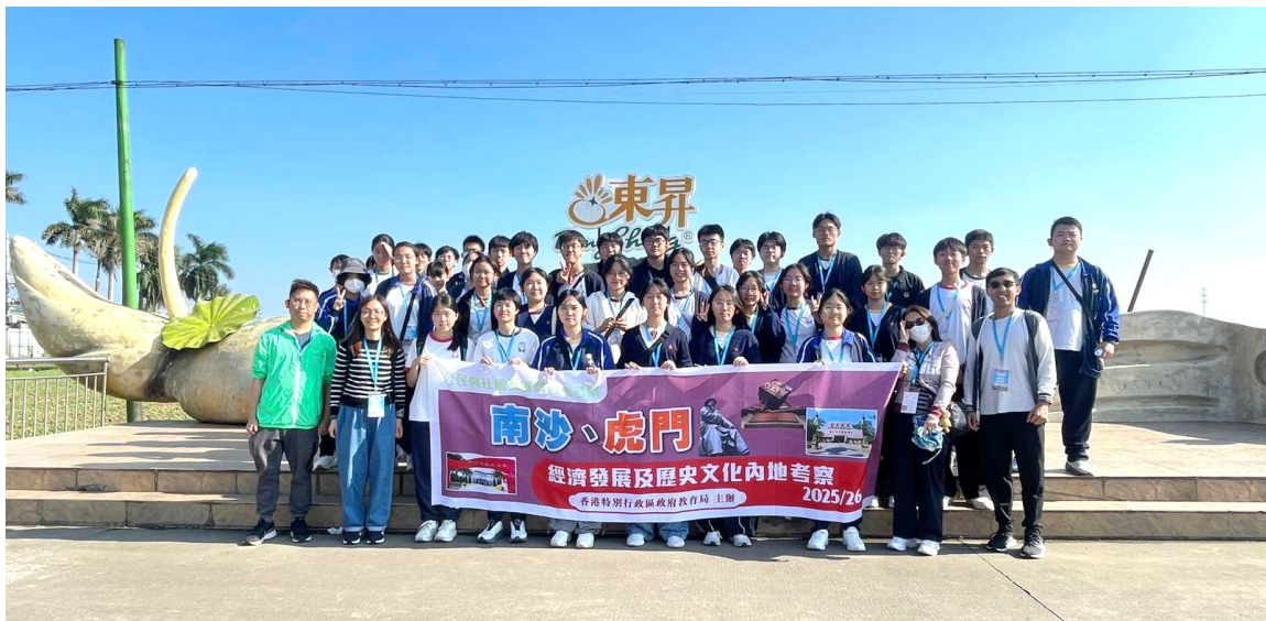
同學到訪南沙東昇農業園，心情興奮