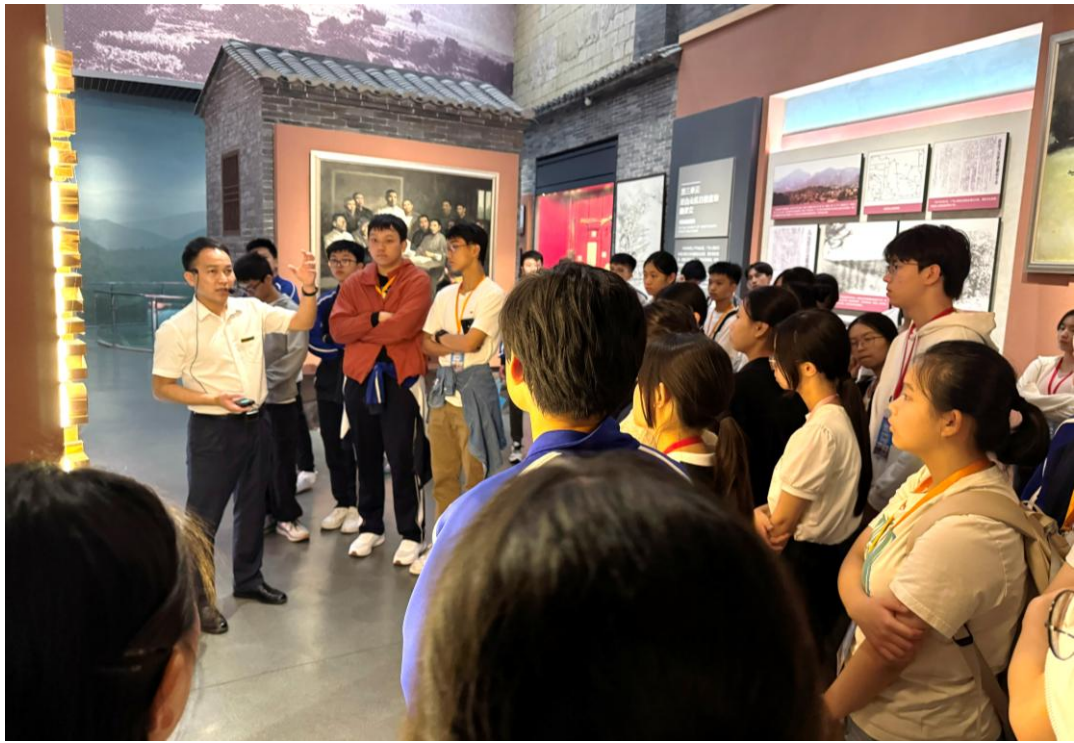
同學仔細聆聽抗戰歷史