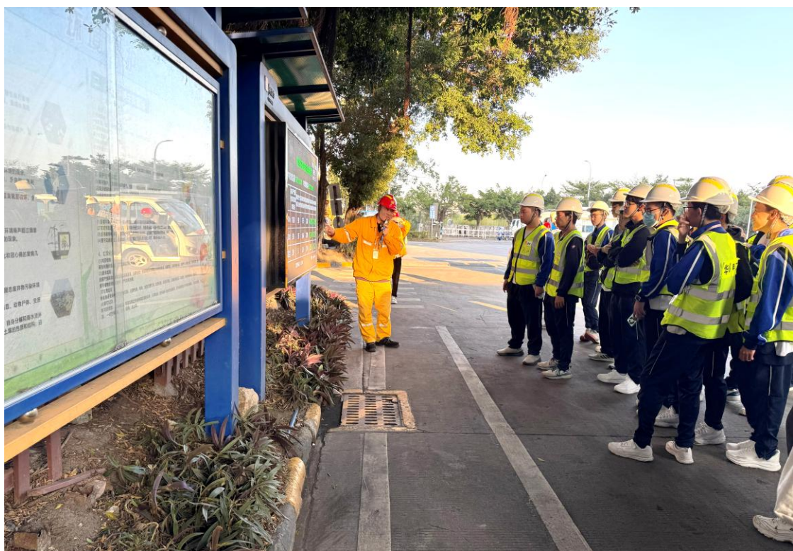
同學聆聽當地發電廠如何把發電污染減到最低