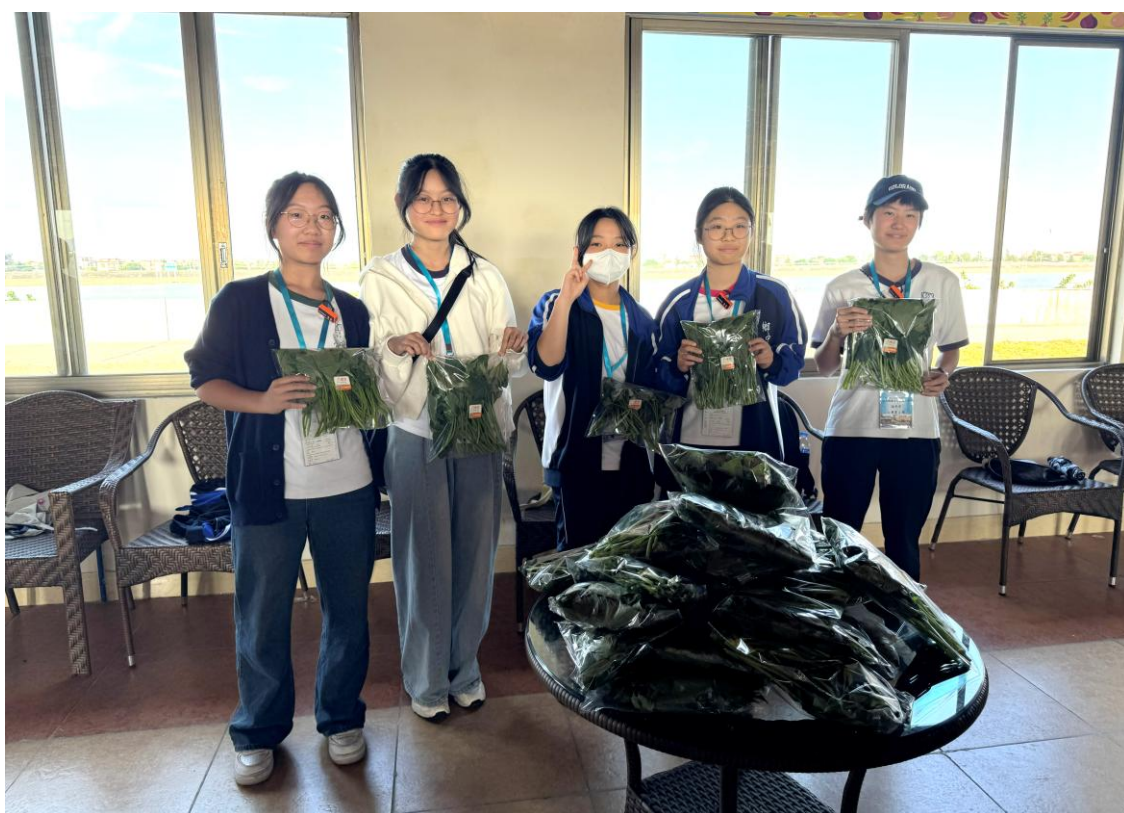
同學成功包裝有機蔬菜，展示學習成果