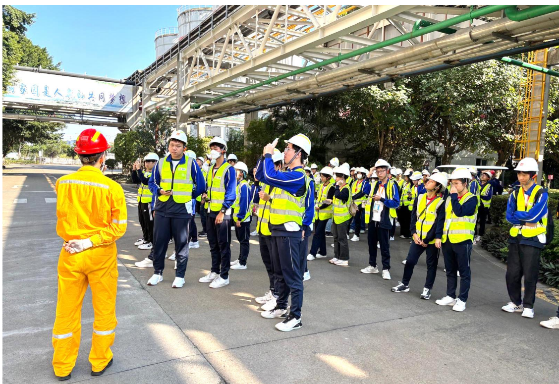
同學參觀發電廠內的設施