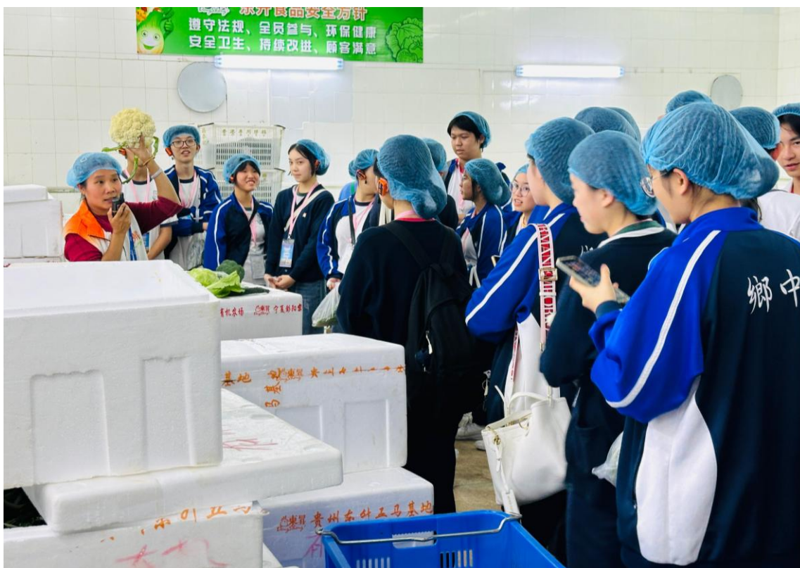
同學參觀了供應蔬菜到香港的工廠