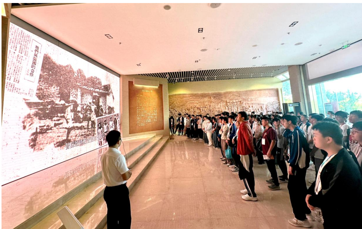
同學於東江縱隊紀念館觀看歷史短片