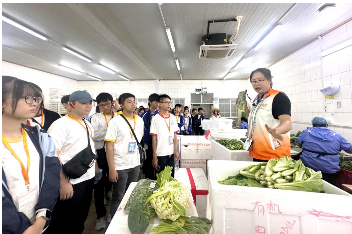
同學了解各種蔬菜名稱與特性