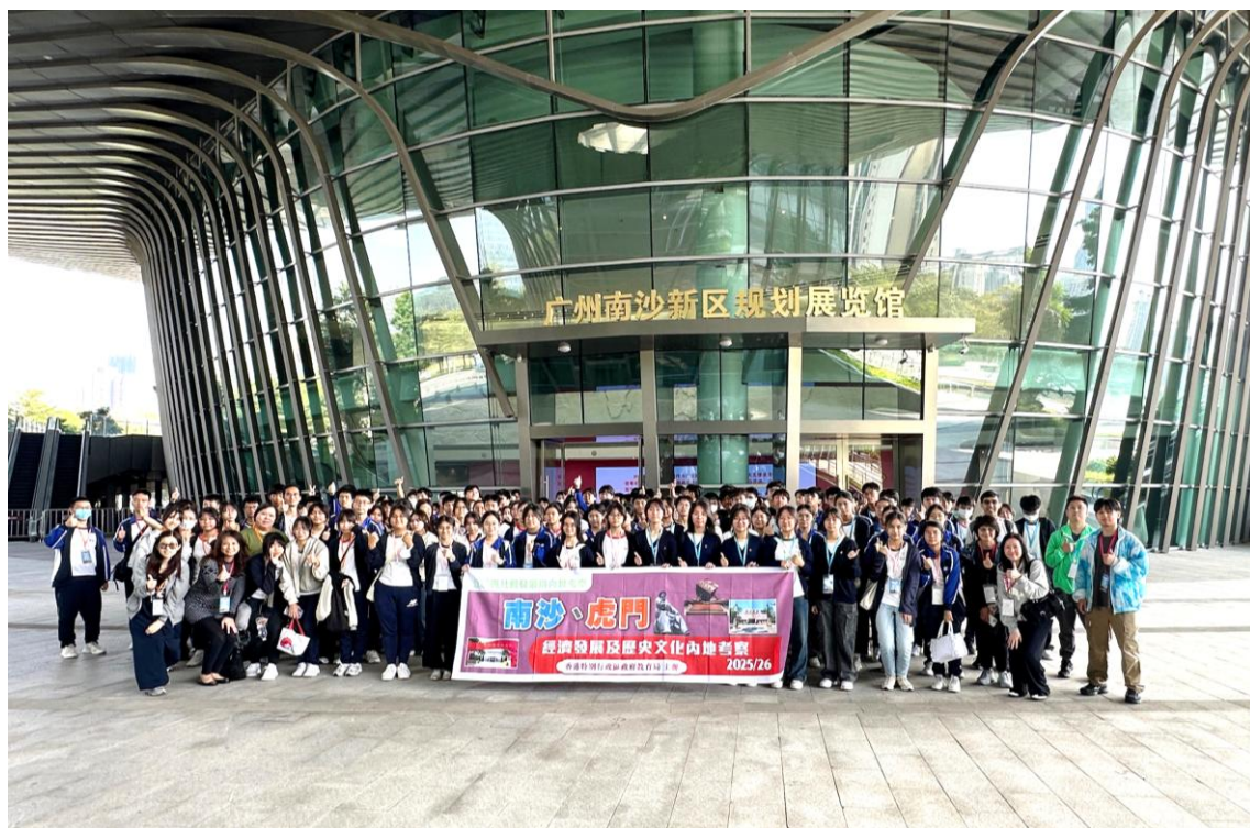
全級中五同學於廣州南沙新區規劃展覽館前拍攝大合照