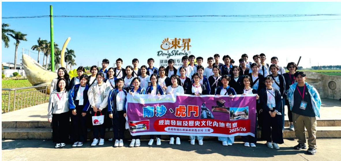
同學準備參觀南沙東昇農業園，充滿期待