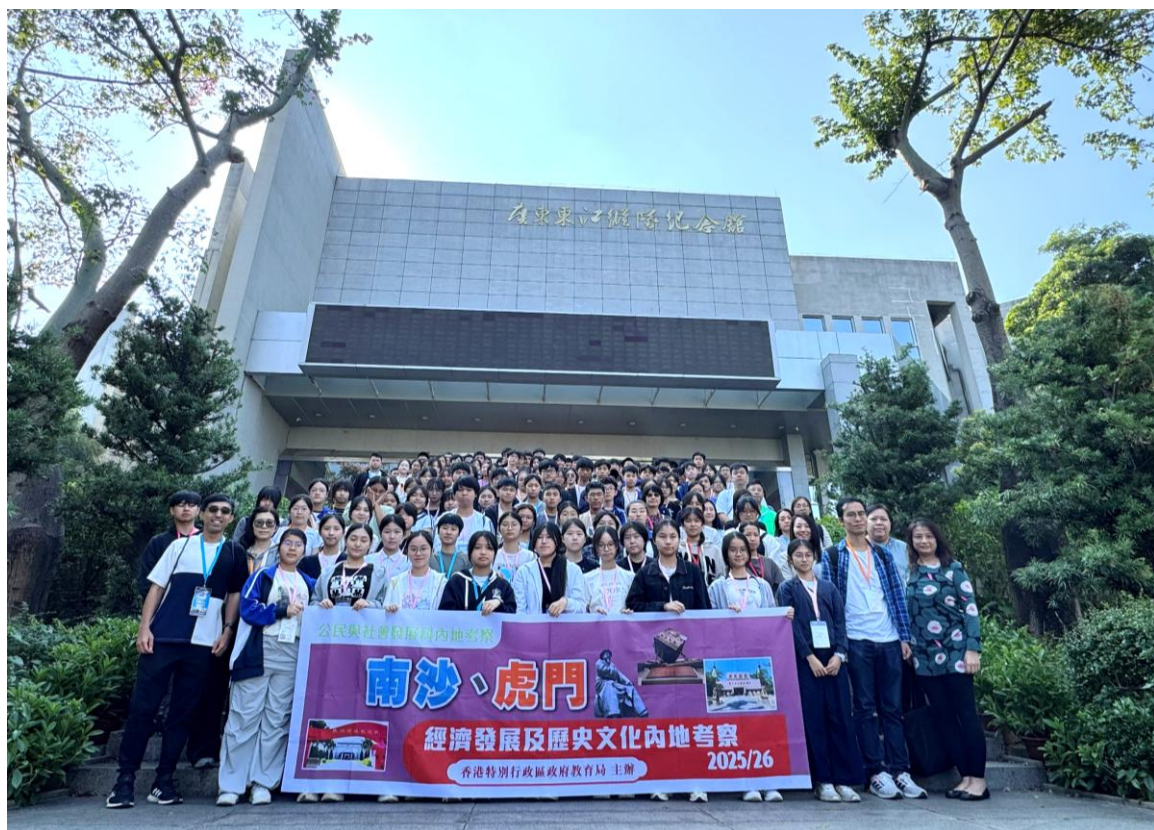
本校同學到訪東江縱隊紀念館