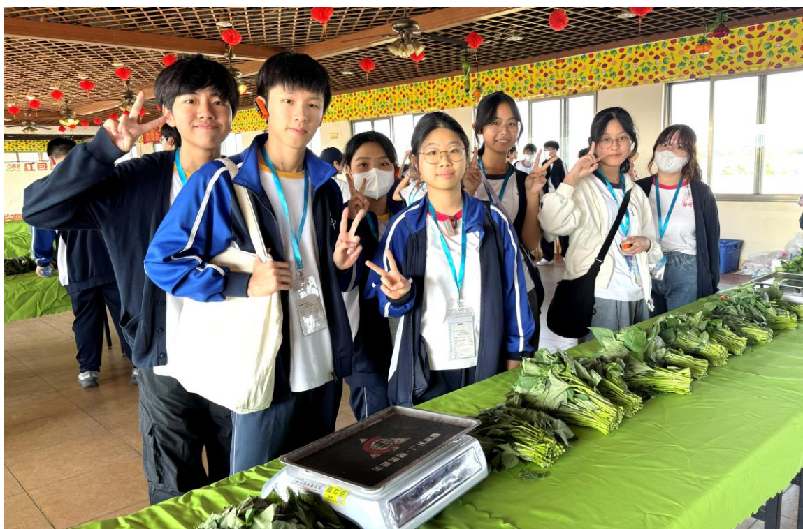
同學親手參與蔬菜包裝