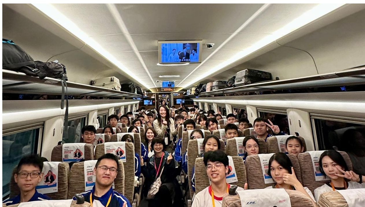
中五同學乘坐高鐵從西九龍站出發到廣州南站