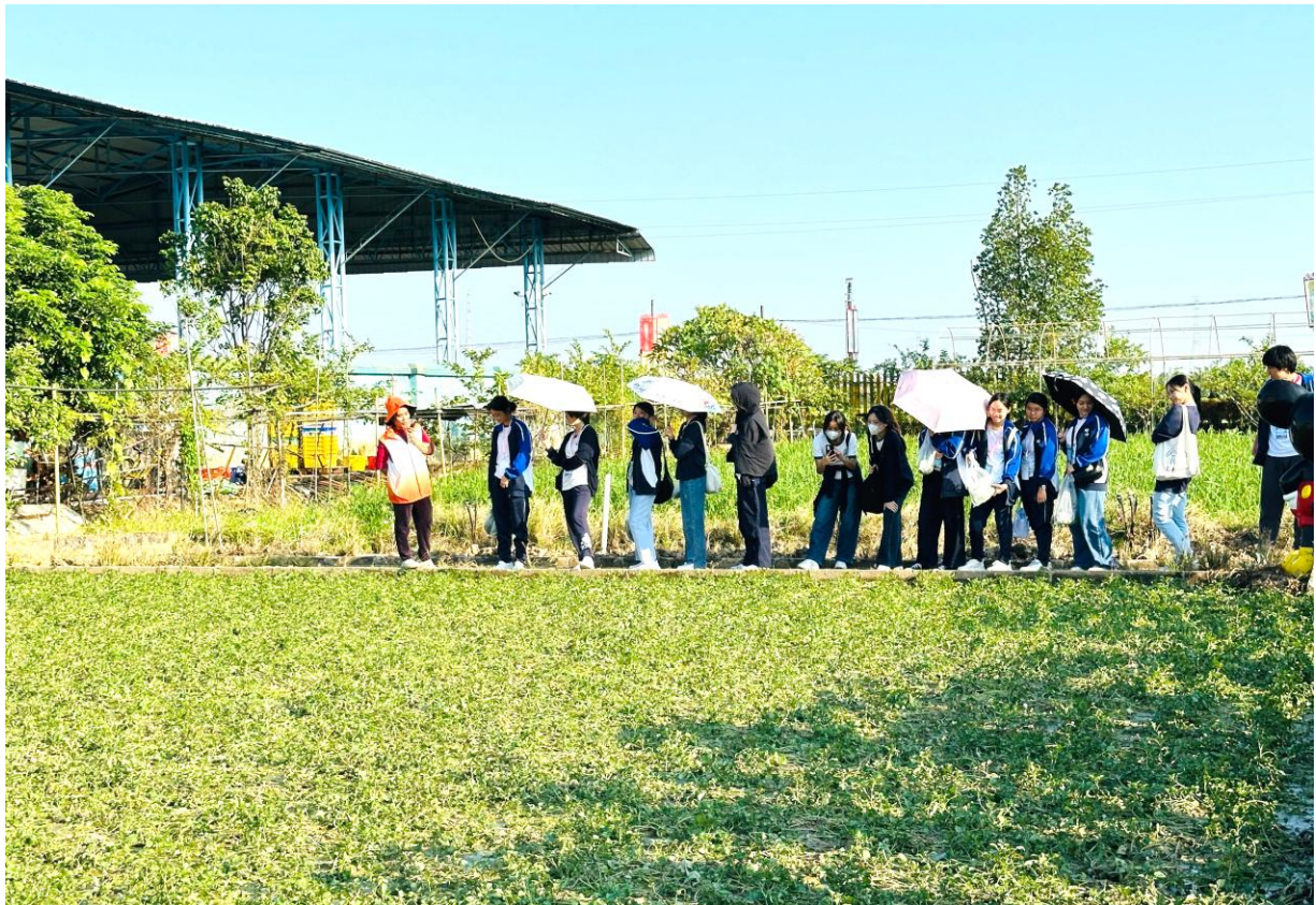
同學實地觀察蔬菜種植環境