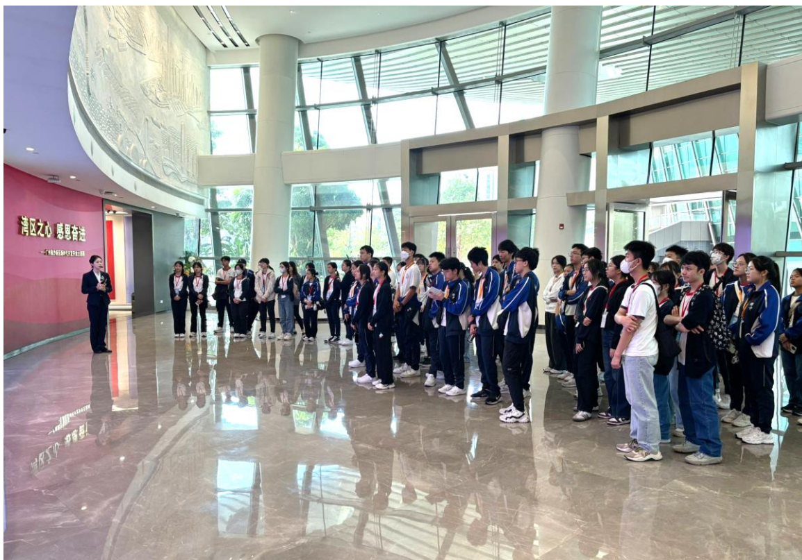
同學細心聆聽導賞員講解南沙新區的發展