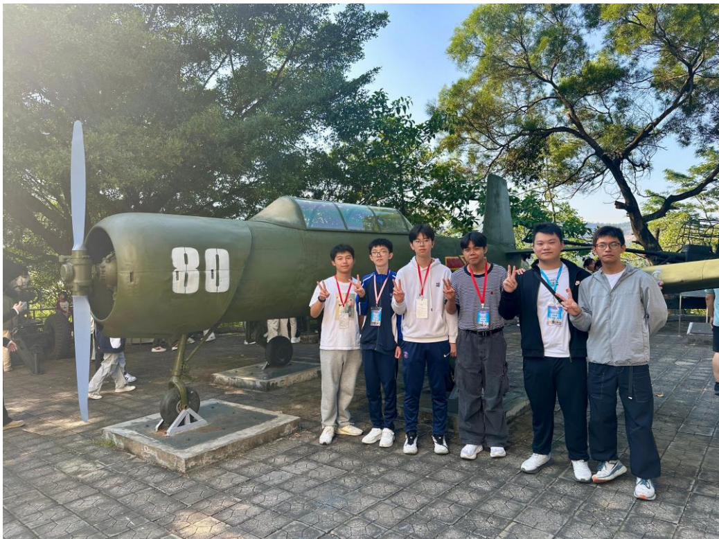
同學於戰機前拍照