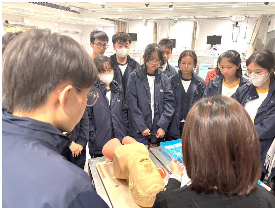
彭博士講解各類臨床程序