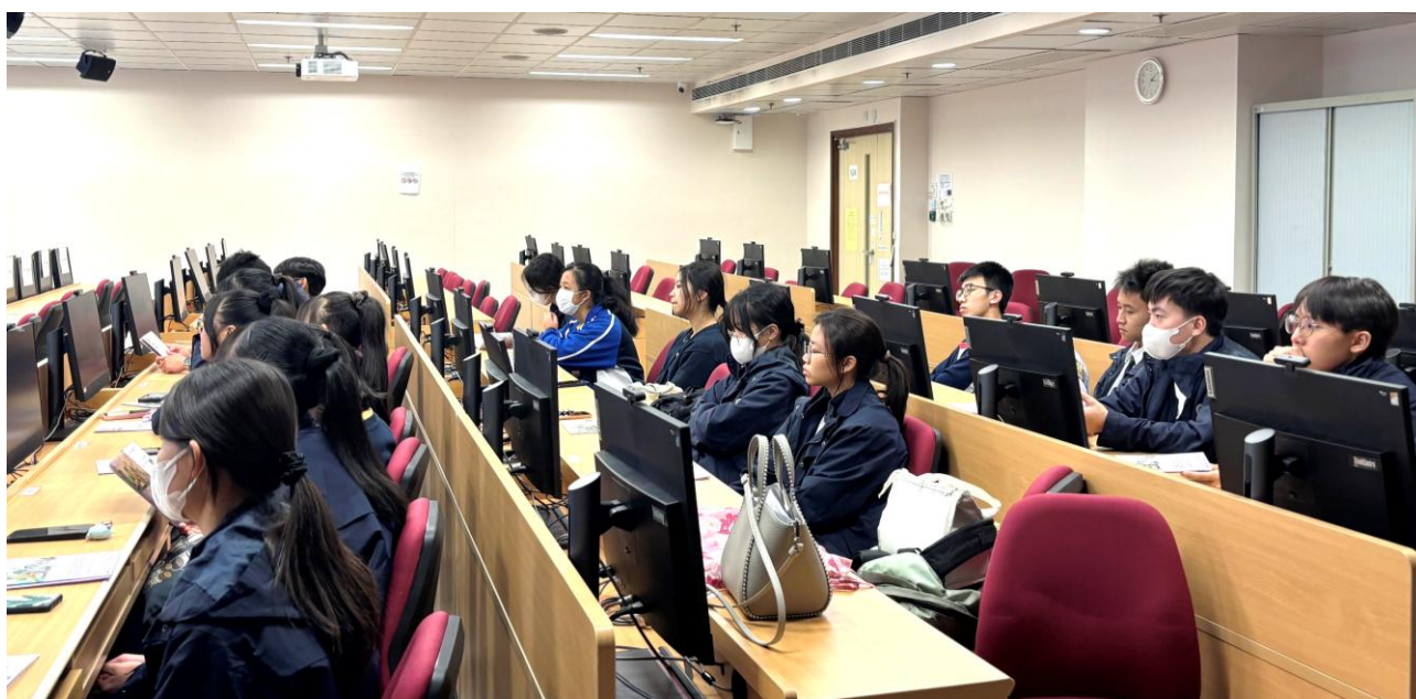
學生在護理學系入學講座上聚精會神地聆聽講者發言

在活動中，本校有幸獲 那打素護理學院特別安排，開放實驗室予本校同學參觀及體驗。學生們能夠親身感受護士的日常工作，包括臨床技能訓練及護理專業的基本操作，從而深入了解醫護人員的專業精神與工作環境。同學們全程投入，積極參與各項體驗活動，並藉此機會思考自身的生涯規劃方向。這次跨學科活動不僅增進了同學對醫護專業的認識，更為他們未來的學習與職業發展奠定了良好基礎。