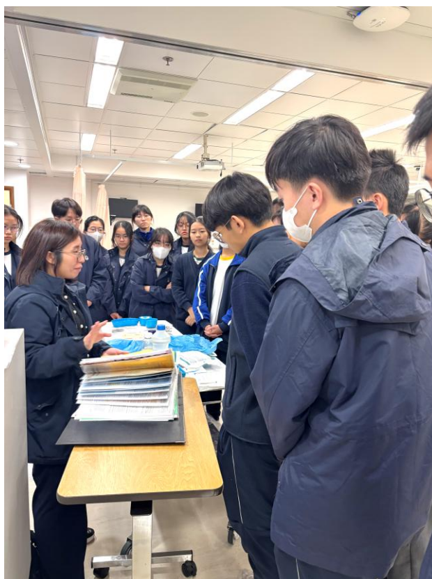
彭博士講解各類臨床程序