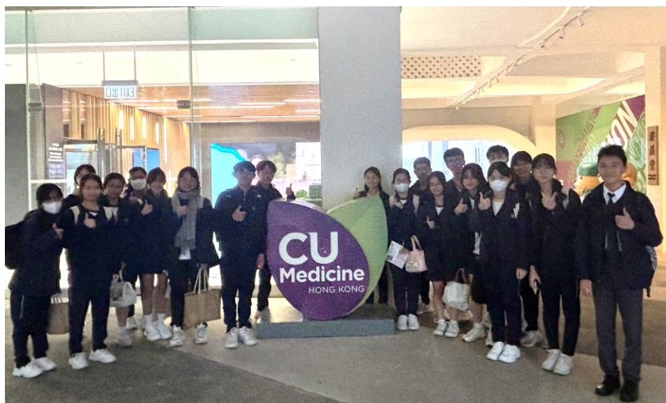
同學於護理學院外合照