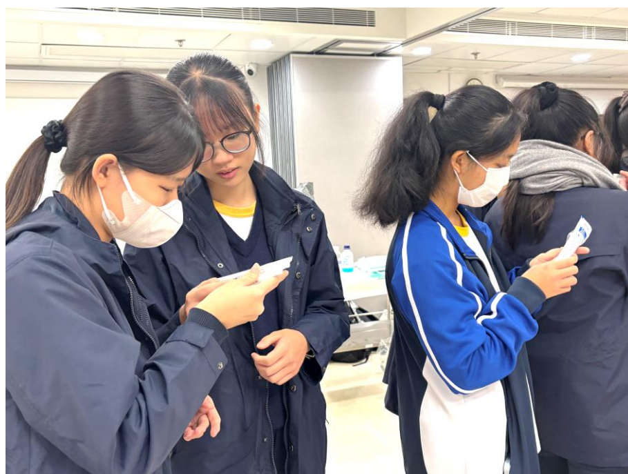
學生親身研究操作臨床針筒