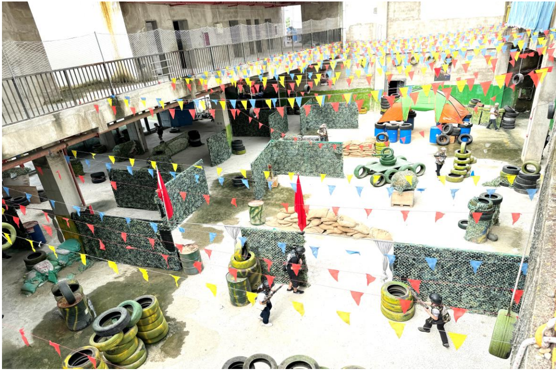
團員投入活動，建立團隊精神