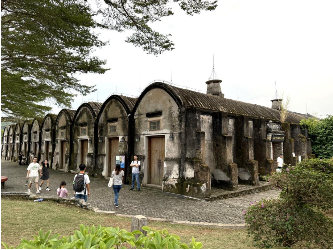
團員於大鵬所城內的古蹟留影