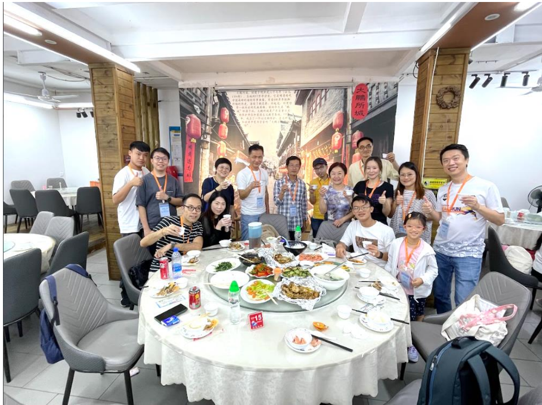
團員於鵬城享用午餐，氣氛歡洽