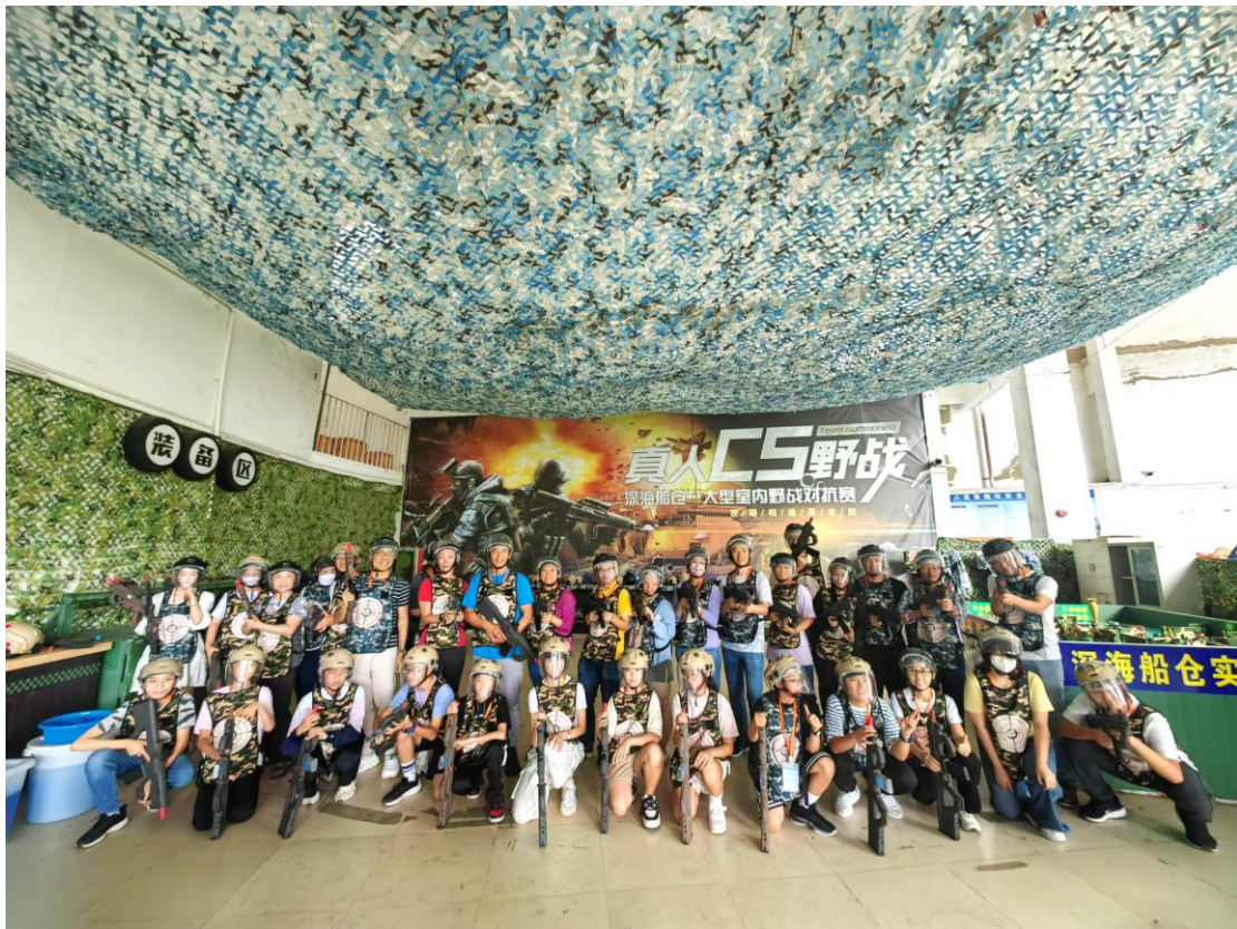
團員投入參與團隊建設活動