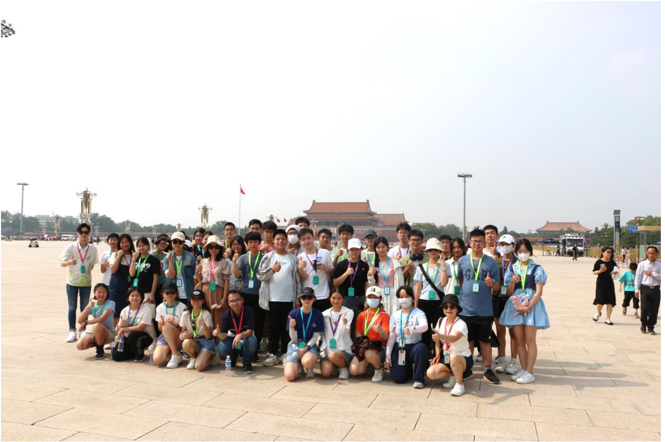
同學在天安門廣場留影