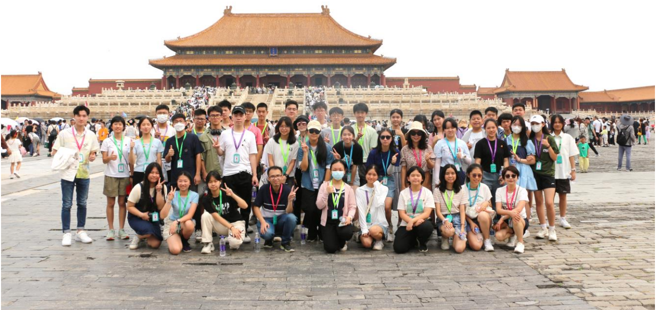
同學參觀故宮博物院