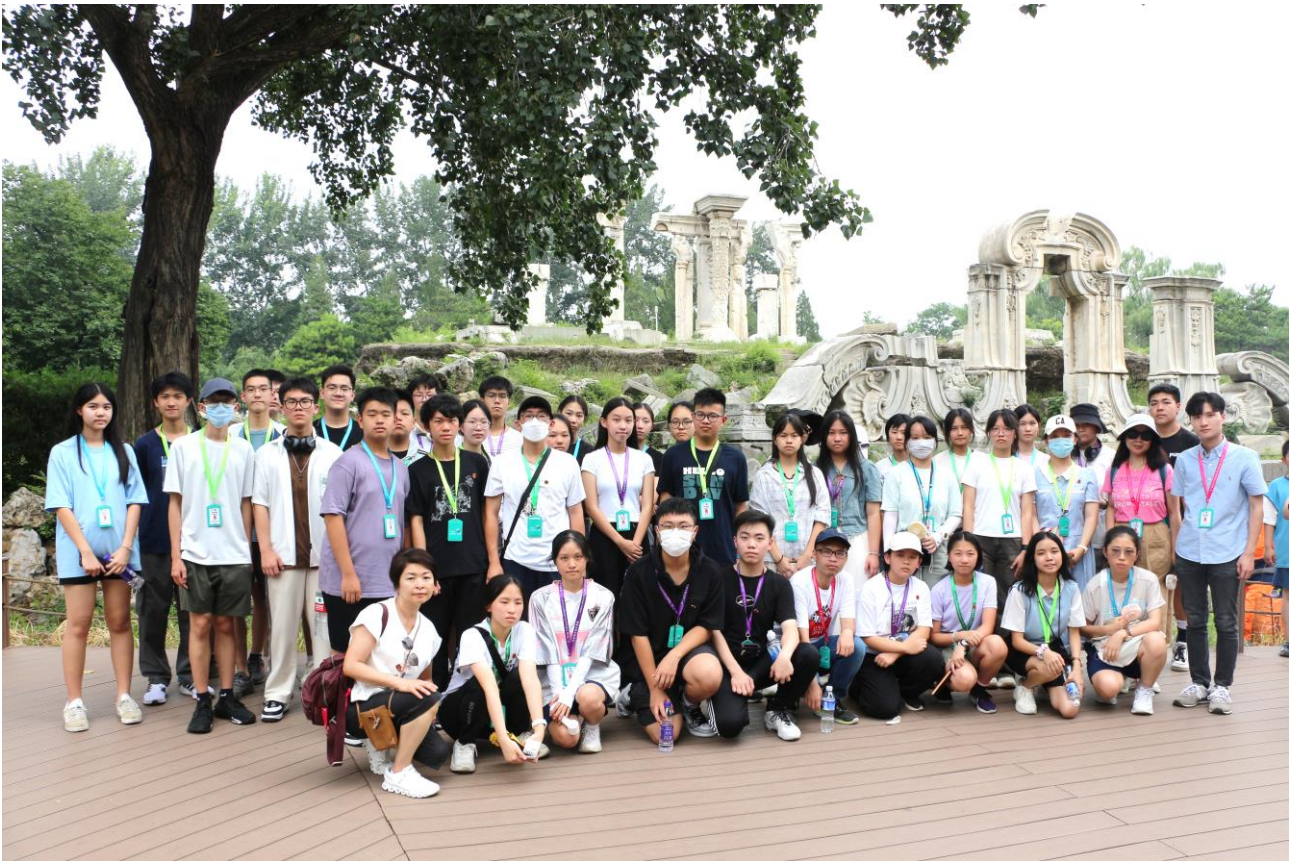
同學到圓明園考察歷史文化