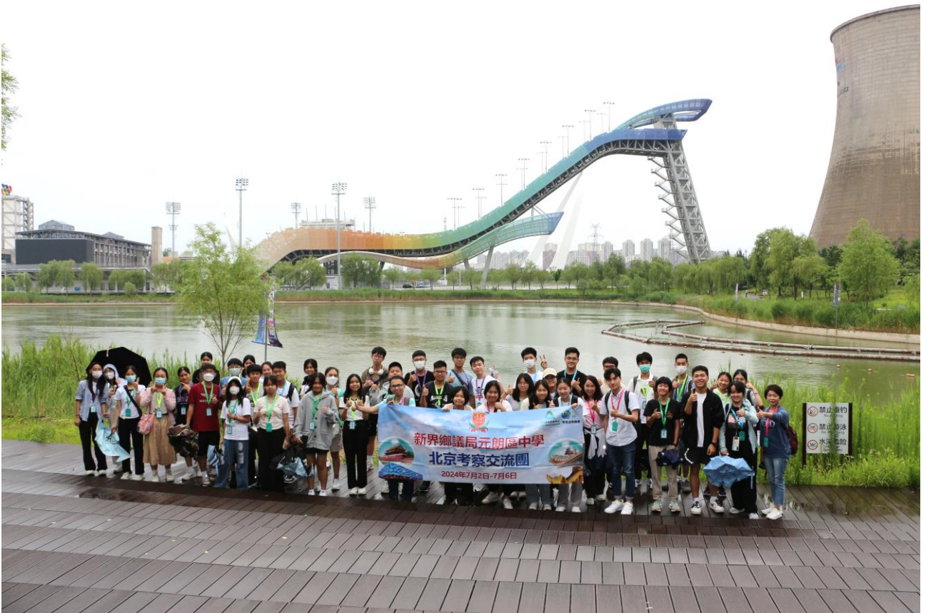
同學參觀冬奧會場首鋼園