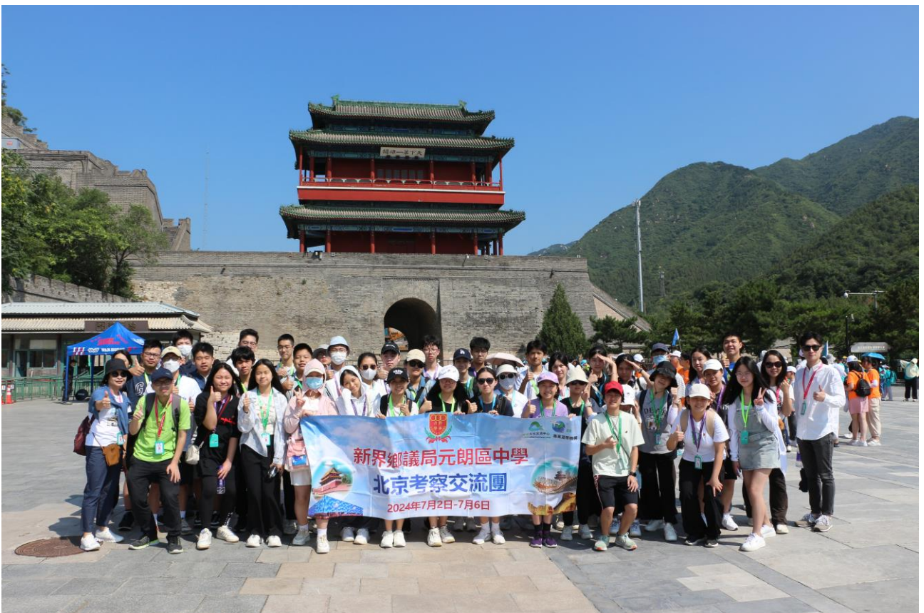
同學登長城前，在居庸關留影。