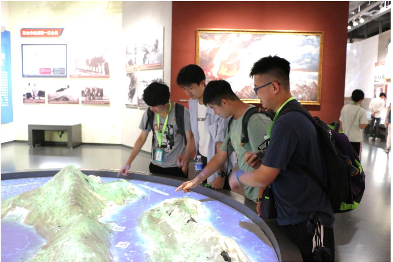
同學在中國航空博物館內研究