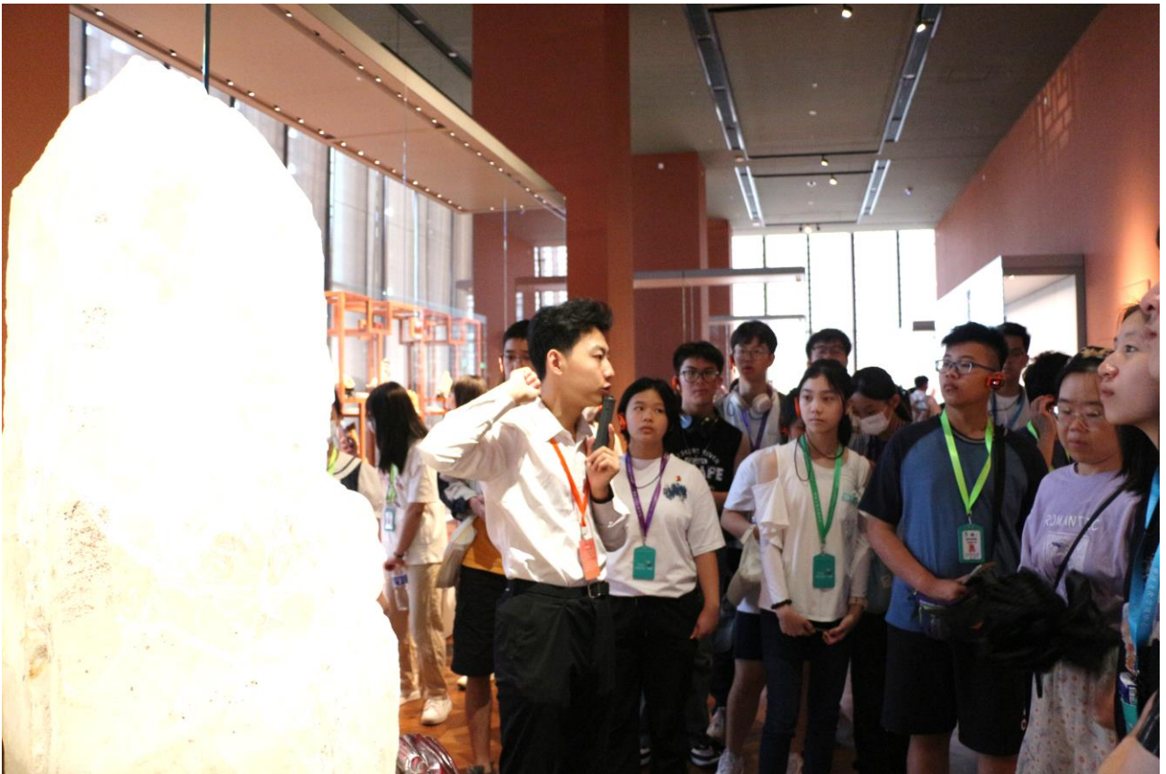
同學在中國工藝美術館內細聽導賞員介紹展品