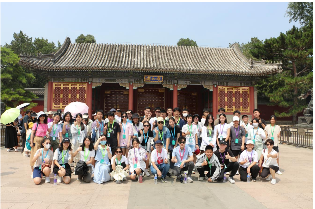
同學到頤和園了解相關歷史