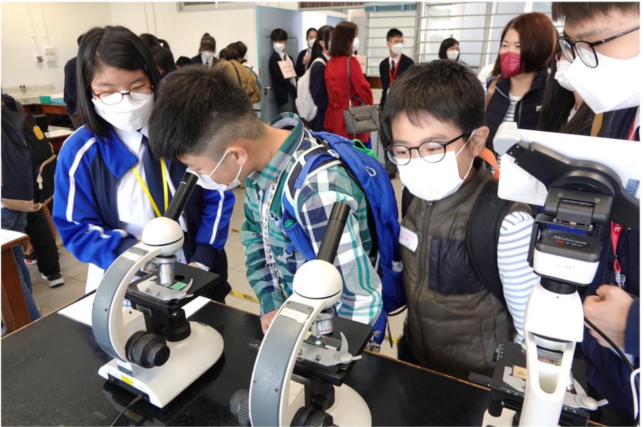
小六學生對科學實驗甚感興趣