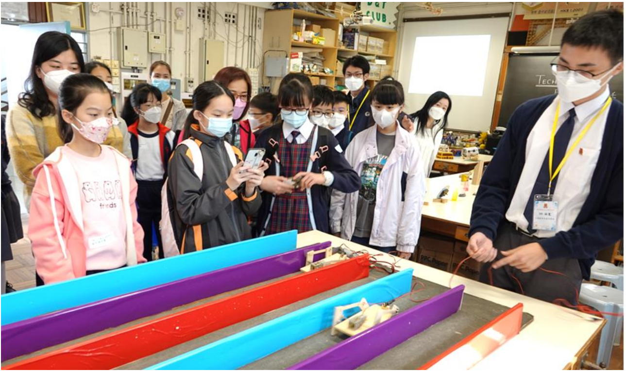
科學與科技計劃：四腳機器人競賽