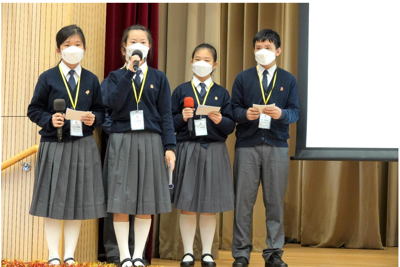
中一入學面試經驗分享