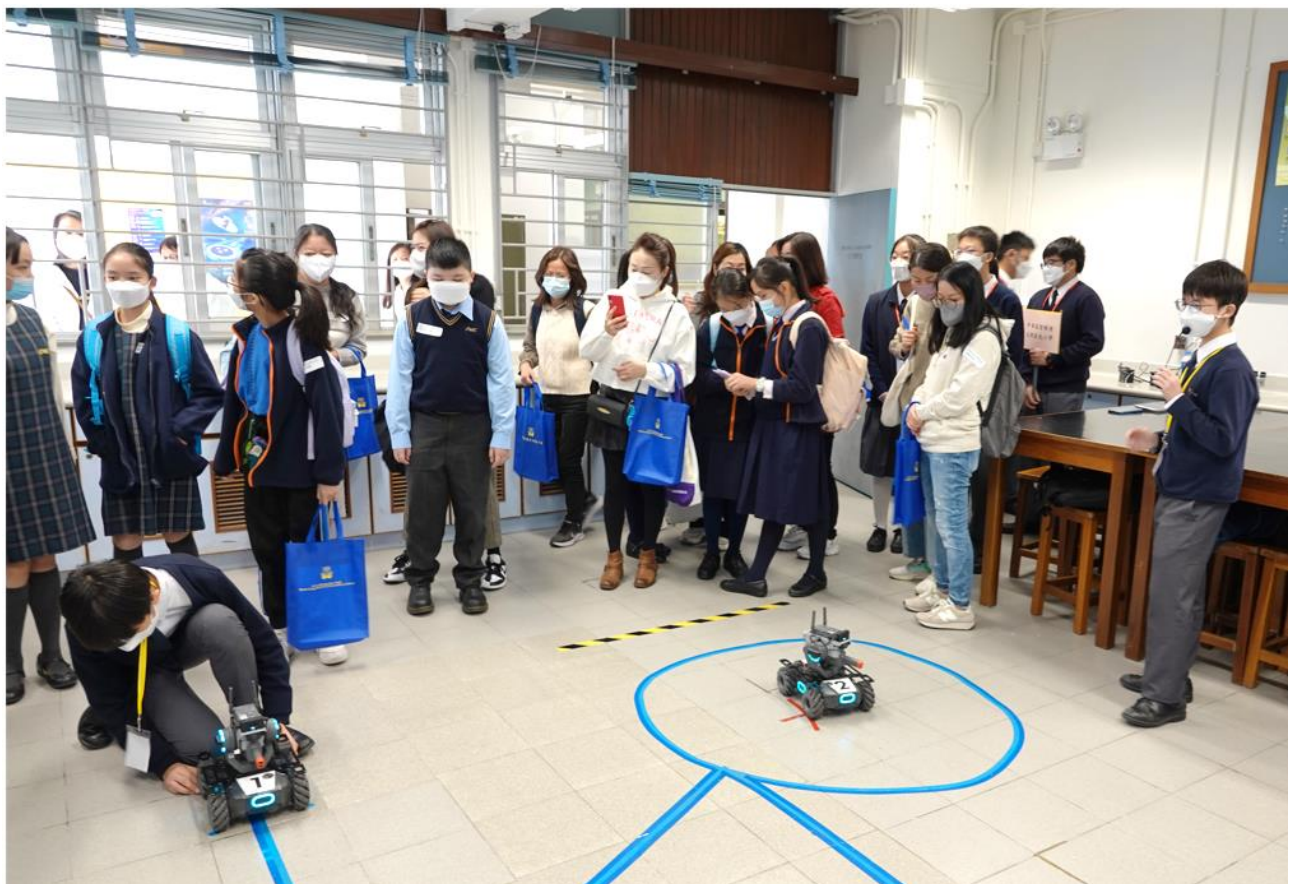
STEM Team 示範操作機械人