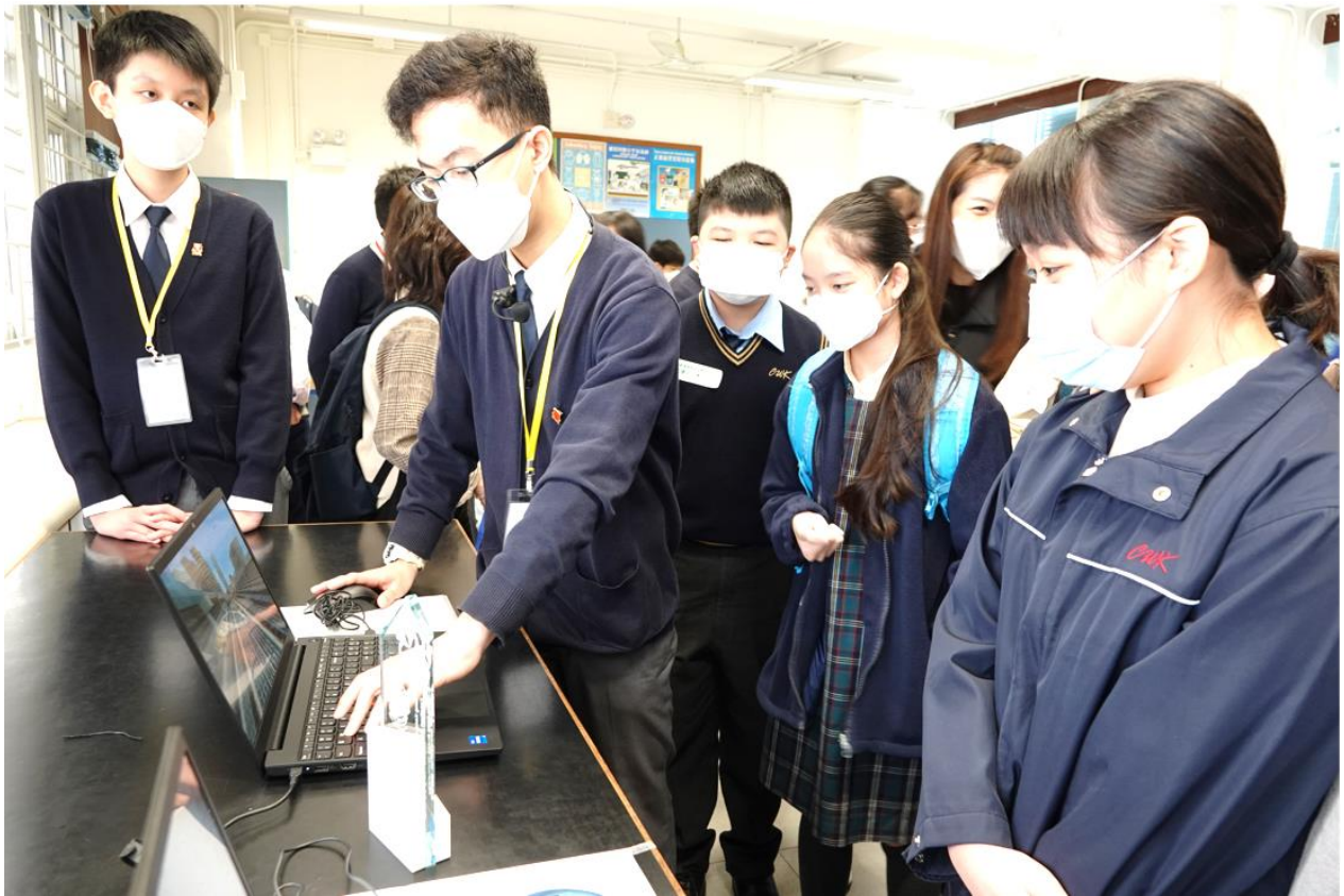
STEM 比賽得獎作品示範