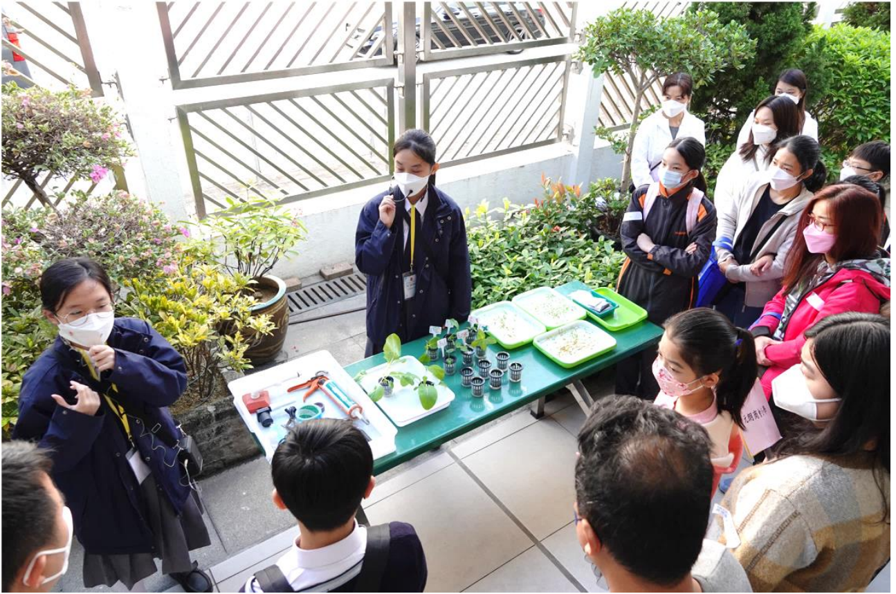
同學介紹水耕種植