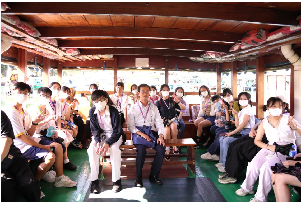
學生於香港仔搭乘街渡前往鴨脷洲