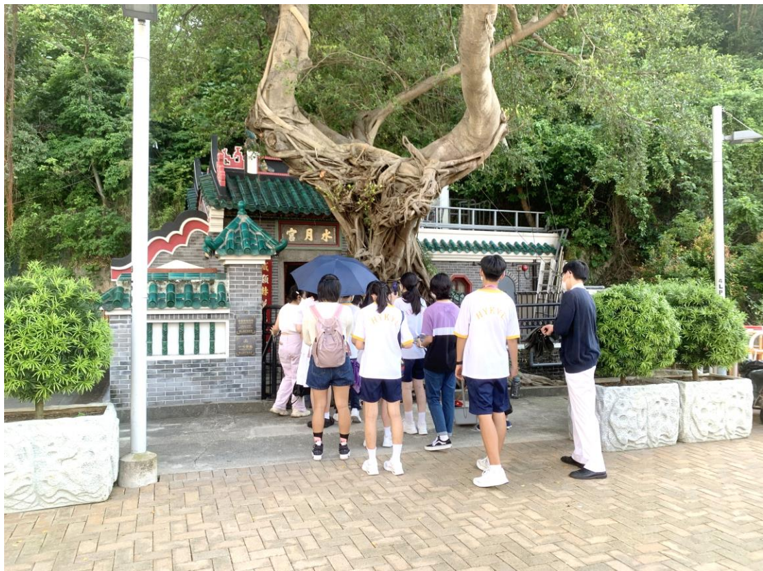
學生參觀鴨脷洲水月宮