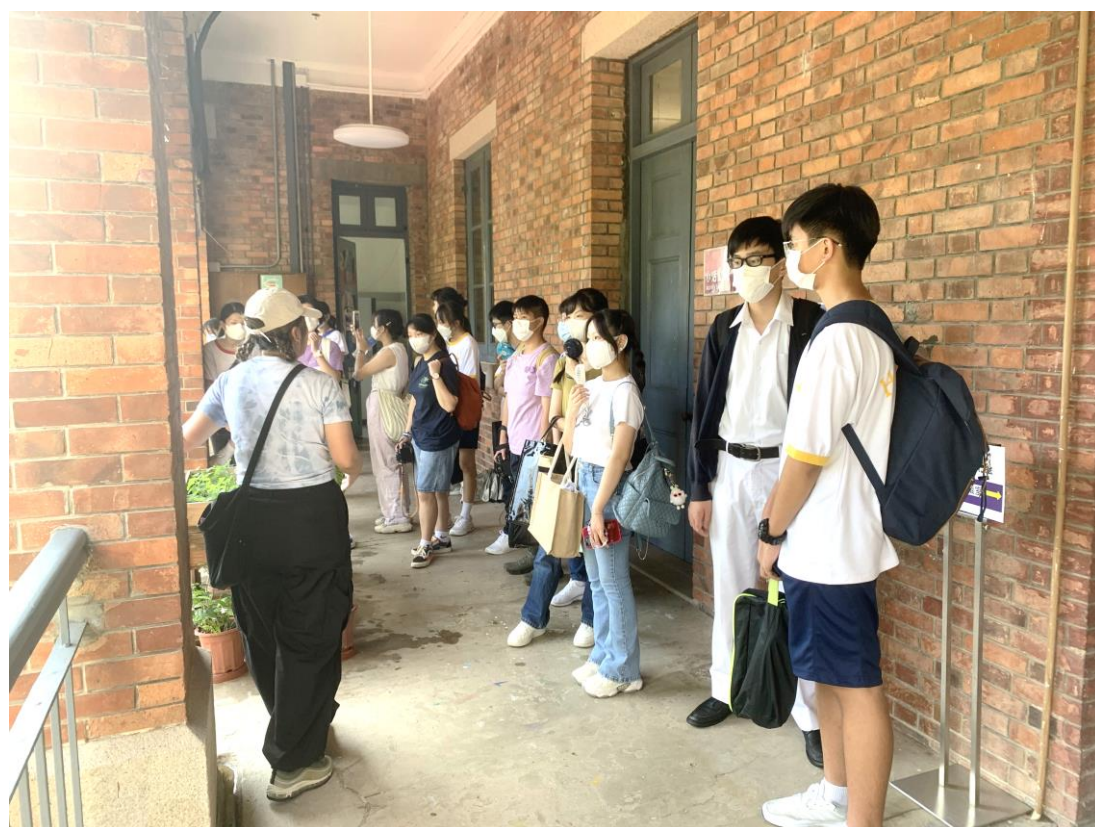
學生細心聆聽導師講解香港仔和鴨脷洲的歷史