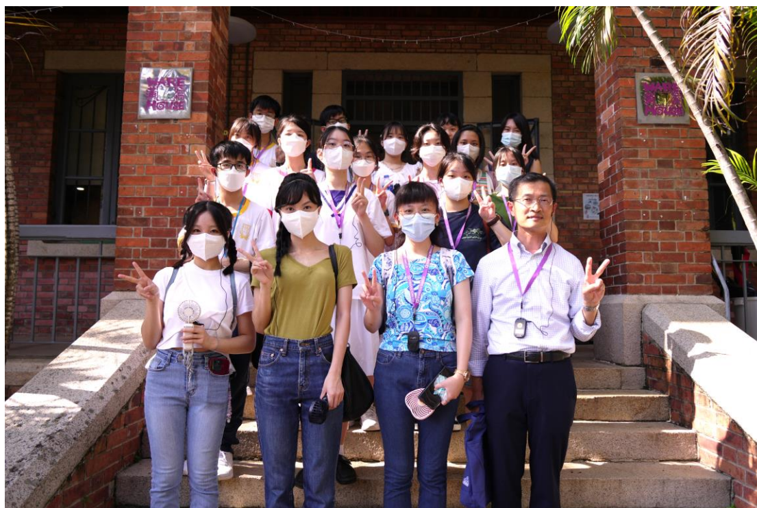
師生於舊香港仔警署(現址為蒲窩青少年中心)門前合照

2023年7月14日(星期五)下午，歷史學會組織中三至中五學生到香港仔和鴨脷洲考察。藉着參觀兩地歷史建築，學生既增加對香港歷史的認識，同時也擴闊視野。