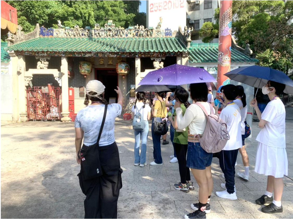
學生參觀鴨脷洲洪聖古廟