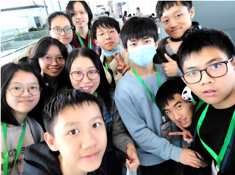
同學在跟不同學校的學生合影