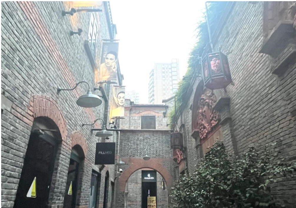
同學遊覽上海中西合璧的街道，瞭解上海歷史文化與社會發展集一身的特點。