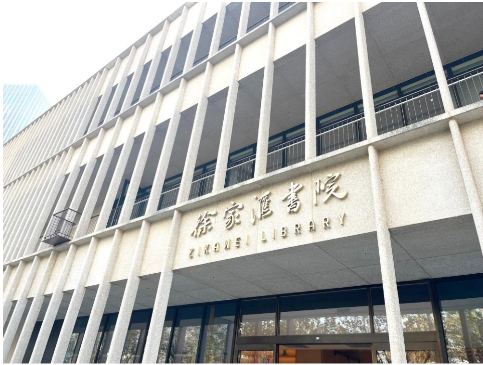
同學參觀徐家匯書院，感受濃厚的閱讀氛圍，見識到不少珍貴的藏書、手稿等