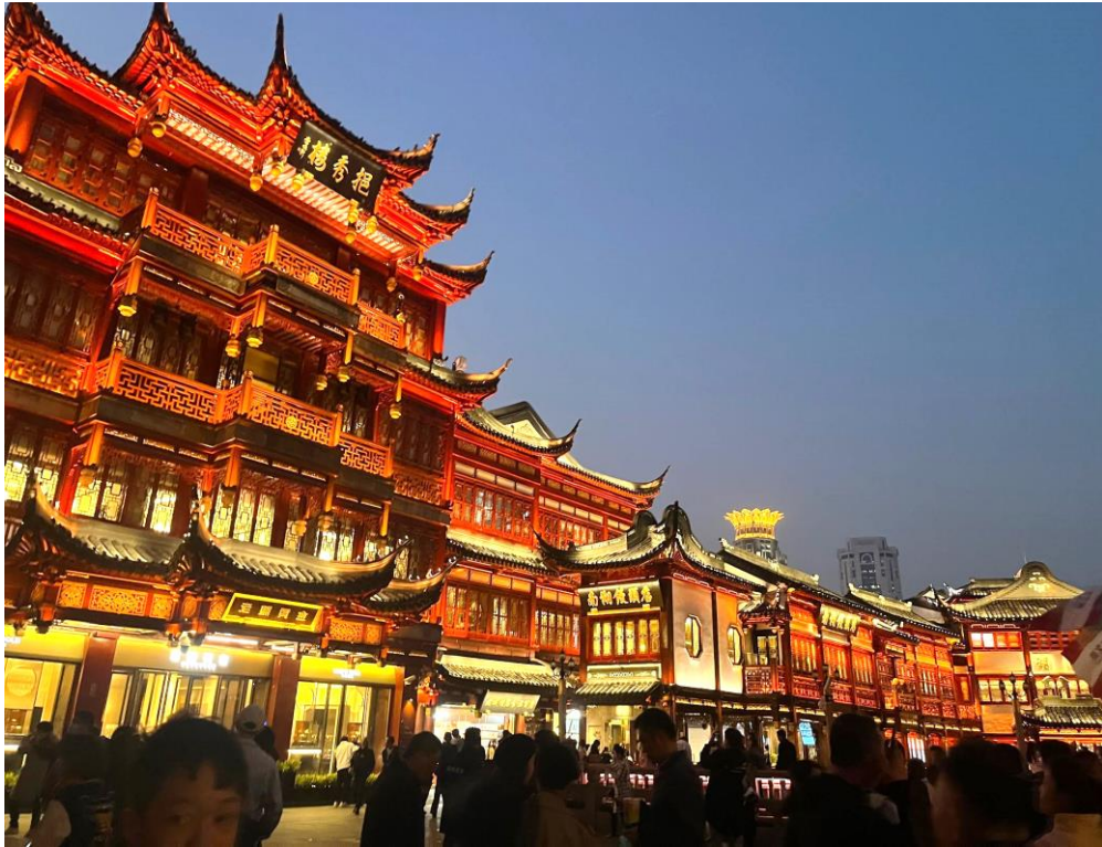
同學遊覽上海兩大旅遊景點——外灘與城隍廟， 在這融合歐洲與東方建築的環境裡感受獨特的上海風情。