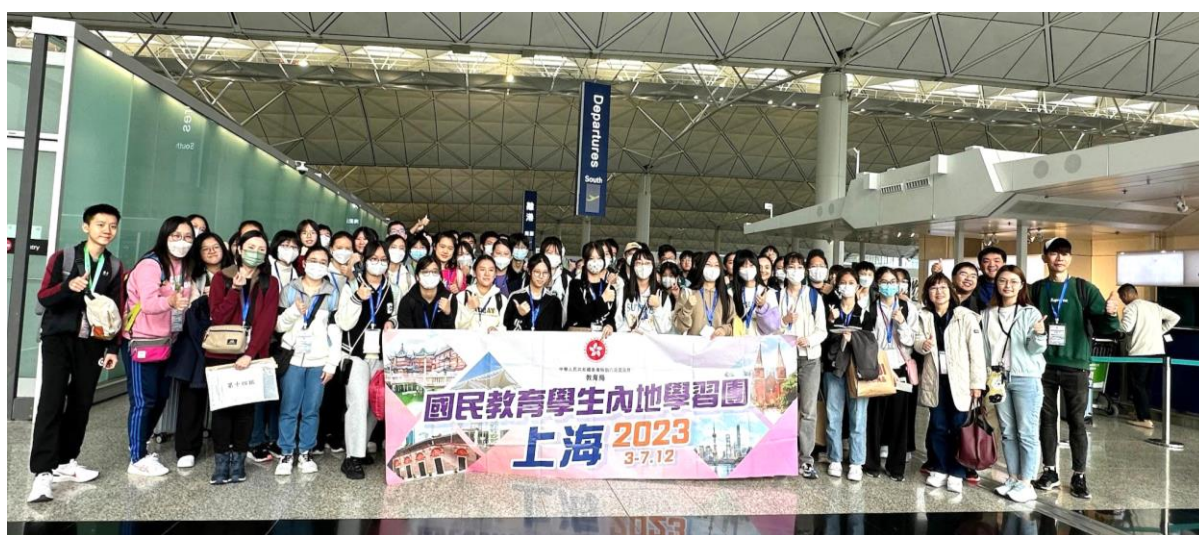
同學於香港國際機場出發，開啟上海之旅

是次活動旨在促進同學對《憲法》、《基本法》的了解，增加他們對祖國歷史、文化與最新發展的認識，並提升他們的國民身分認同及維護國家安全的責任感。