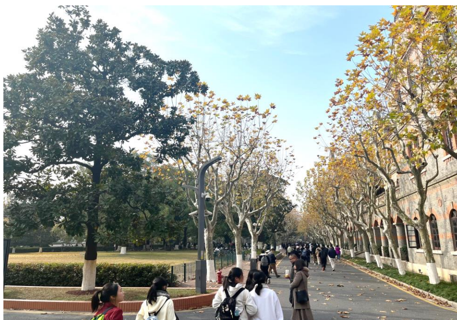
同學參觀校園，並聽了一節大學課堂，十分有趣