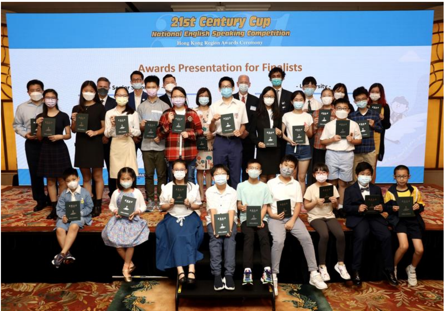
Students and guests pose for a group photo at the awards ceremony of the Hong Kong regional final of the “21st Century Cup” English speaking competition, Hong Kong, Sept 4, 2021.