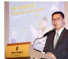
香港特別行政區教育局局長楊潤雄致辭。