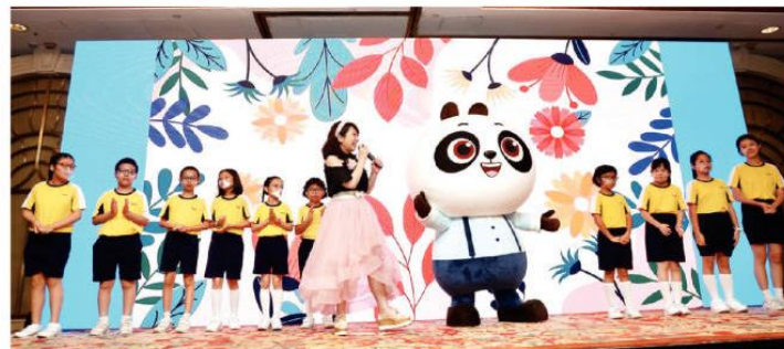
香港兒歌天后 Purple 姐姐、VDO English 吉祥物蛋仔和來自屯門官立小學的學生們一同現場獻唱。

在英語演講比賽的舞臺上，香港選手們各展風采，除了發揮本身英文演講潛能之餘，更有機會體驗到兩地文化的交流碰撞，還可以結識來自全國各地的新朋友，擴闊人際網絡和生活圈子。