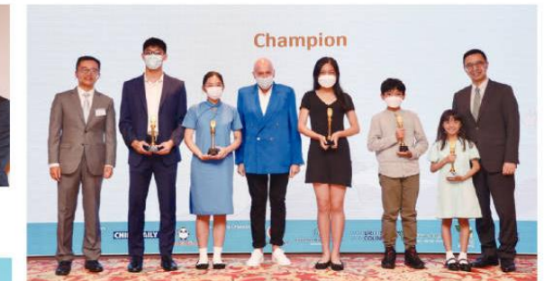
嘉賓們為冠軍得主頒獎。