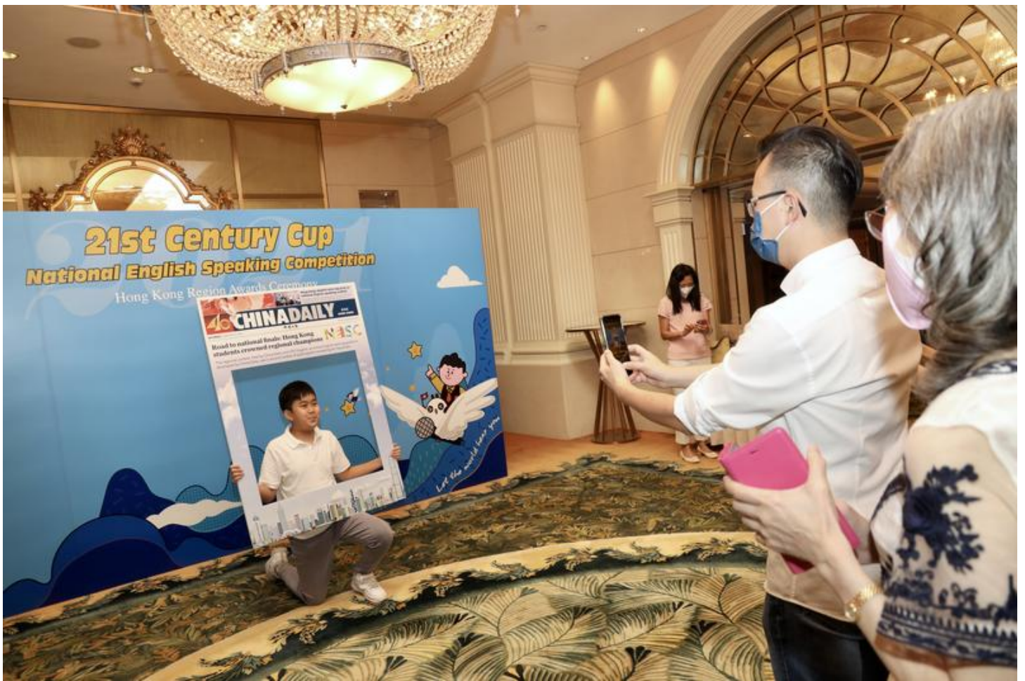
A student poses for photos with a cardboard frame cutout at the awards ceremony of the Hong Kong regional final of the “21st Century Cup” English speaking competition, Hong Kong, Sept 4, 2021.