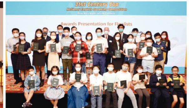
頒獎典禮完美落幕，七位選手將代表香港出戰今年 10 月的全國總決賽，讓我們拭目以待選手們的表現。