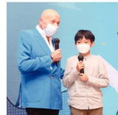
蘭桂坊集團主席盛智文作為本次頒獎禮的特別嘉賓，與冠軍選手對話。