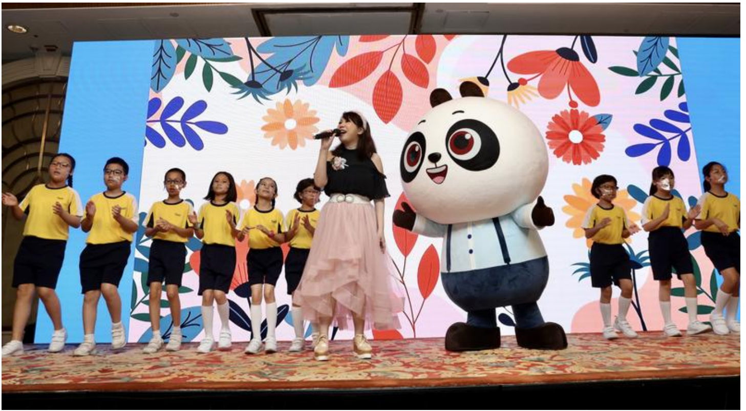
Students, guest singer and VDO English mascot Panda Chan sing and dance at the awards ceremony of the Hong Kong regional final of the “21st Century Cup” English speaking competition, Hong Kong, Sept 4, 2021.