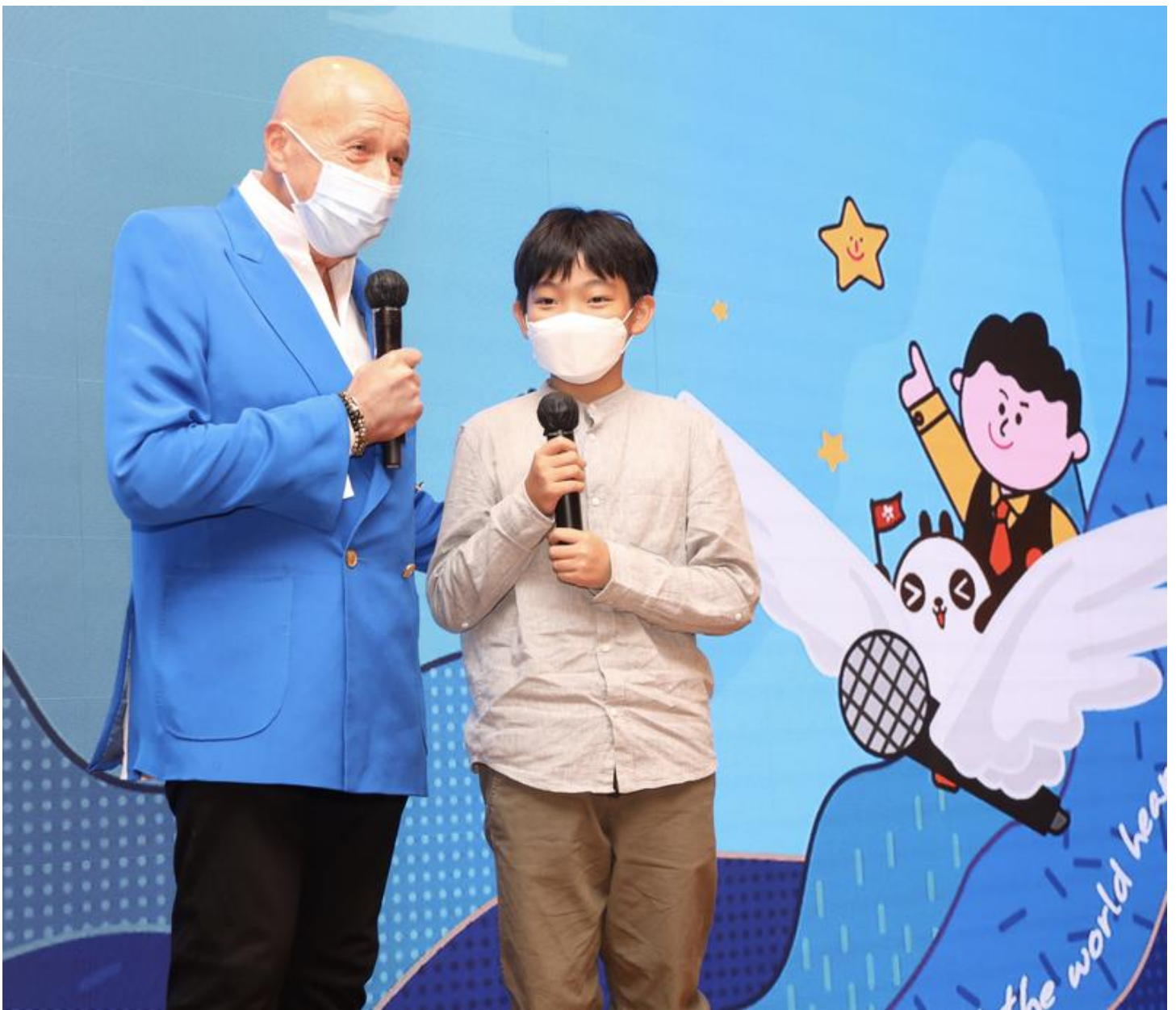
Lan Kwai Fong Group's Chairman Allan Zeman interacts with a student on stage at the awards ceremony of the Hong Kong regional final of the "21st Century Cup" English speaking competition, Hong Kong, Sept 4, 2021.