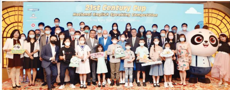
「21世紀杯」全國英語演講比賽頒獎典禮大合照。