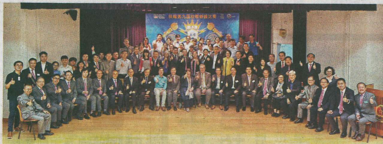
嘉賓、評判、籌委會成員、扶輪社社員及總決賽隊伍大合照。