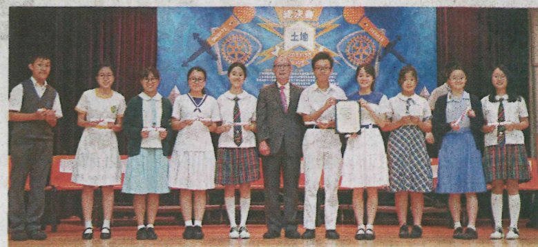
歷場賽事的最佳辯論員聚首一堂。