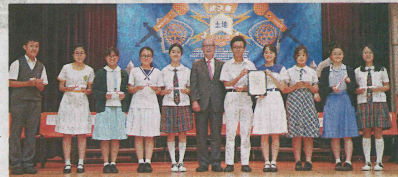
■ 歷場賽事的最佳辯論員聚首一堂。